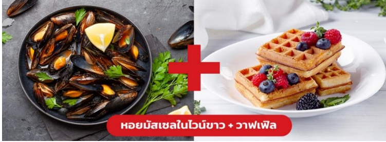
หอยมัสเซลในไวน์ขาว + วาฟเฟิล

เย็น ๑๐ รับประทานอาหารเย็น (เมื่อที่10) เมนูพิเศษ!! หอยมัสเซล + วาฟเฟิล (Mussel in White wine + Waffle)