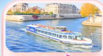
คลองเรือแม่น้ำแซน