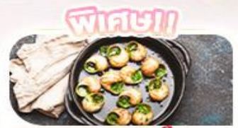
พิซซ่า!! ของแถมสุดดี