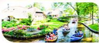
ล่องเรือชมหมู่บ้านทีโรน