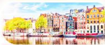
คลองอัมสเตอร์ดัม