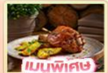
เมนูพิเศษ ขาหมูเยอรมัน