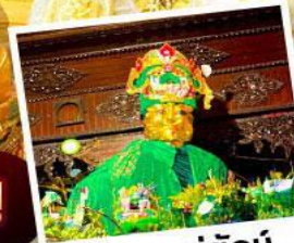
ขอพรแมย์กั๋