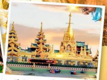
เจดีย์กลางน้ำ (สิริเยิม)