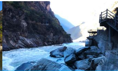
ช่องแคบเลื่อกระโจน

วันที่สาม เมืองจางเจี้ยน-วัดลามะชวงจ้านหลิง-ช่องแคบเลื่อกระโจน-เมืองลี่เจียง-สะพานมังกรดำ-เมืองโบราณลี่เจียง