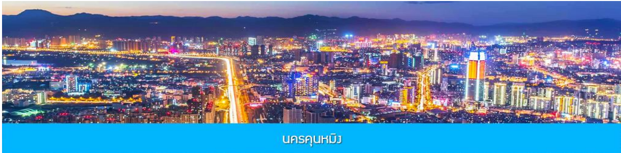
นครคุนหมิง

โปรดอ่าน การเดินทางท่องเที่ยวเส้นทางธรรมชาติที่มีความสูงกว่าระดับน้ำทะเล 4,500 กว่า เมตร ทำให้มีความกดอากาศ และ อากาศเบาบาง เส้นทางนี้จึงไม่เหมาะกับท่านที่เป็นโรคความดันสูง, โรคหัวใจ ไม่แนะนำให้เดินทางท่องเที่ยวเส้นทางนี้ เพราะเป็นอันตรายต่อสุขภาพ