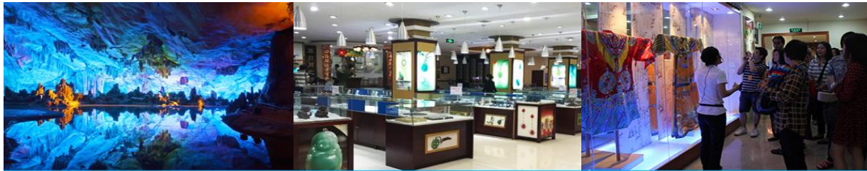
ถ้ำลุ่ยอ้อ

พักที่ GUILIN VIENNA HOTEL โรงแรมระดับ 4 ดาวท้องถิ่น หรือเทียบเท่าในเมืองกุ้ยหลิน