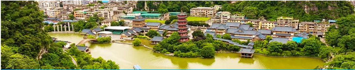
กุ้ยหลิน