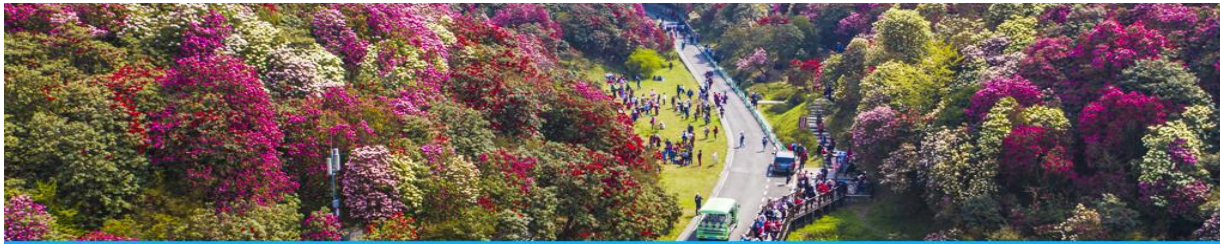
อุทยานทุ่งกุหลาบพันปีร้อยล้าน

พักที่ KAILI HEXIE HOTEL ระดับ 4 ดาวท้องถิ่น หรือเทียบเท่าเมืองช่ายหลี่