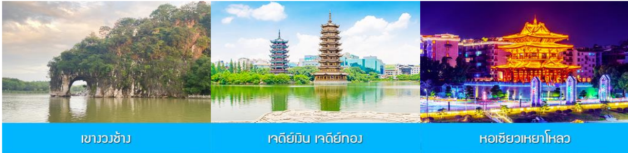
เขาวงช้าง

พักที่ BIJIE HOTEL ระดับ 4 ดาวท้องถิ่น หรือเทียบเท่าเมืองปี้เจีย