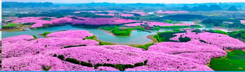
สวนซากุระหมื่นไร่