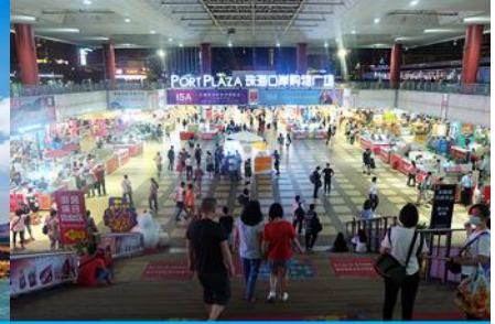
ตลาดใต้ดินกงเป่