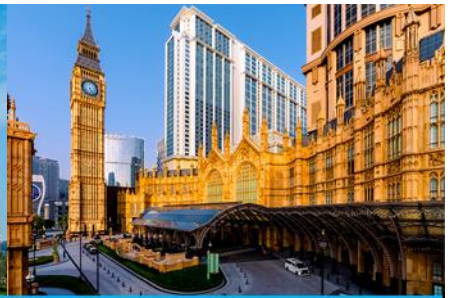
The Londoner Macao