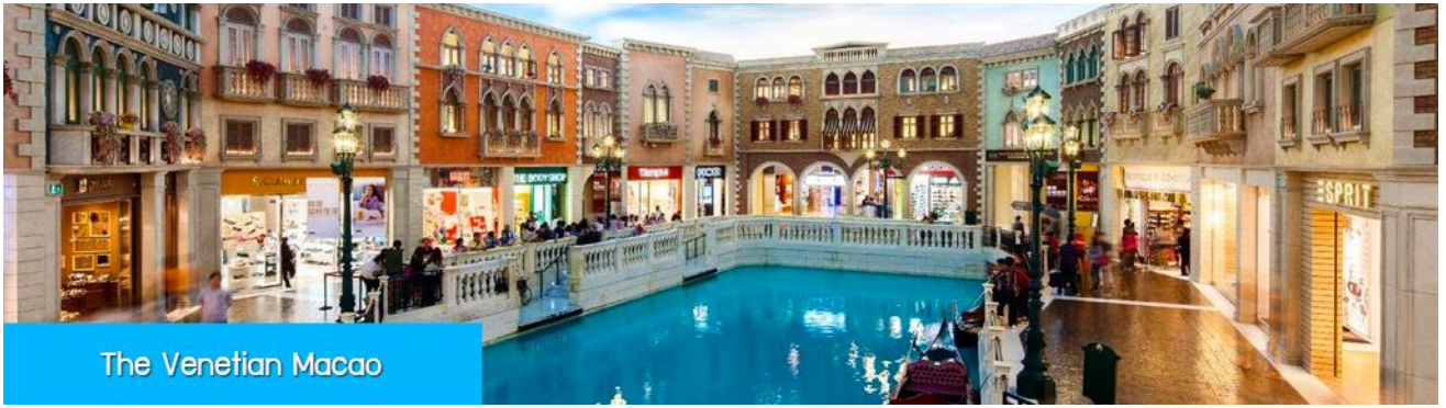
The Venetian Macao