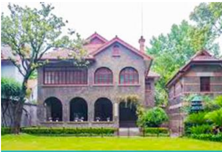
บ้านเกิดซุนยัตเซน

พักที่ IRVINE HOLIDAY HTL OR HUICHANG HTL 3* หรือ โรงแรมในระดับเดียวกันในเมืองจูไห่