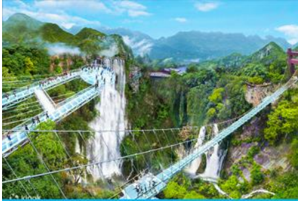
อุทยานกู่หลงเสี

คณะพร้อมกัน ณ ท่าอากาศยานสุวรรณภูมิ อาคารผู้โดยสารขาออก ชั้น 4 ประตู 10 เคาน์เตอร์สายการบิน 9AIR พบเจ้าหน้าที่บริษัทฯ คอยให้การต้อนรับและอำนวยความสะดวกด้านเอกสารและสัมภาระก่อนการเดินทาง