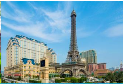
The Parisian Macao