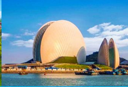
โรงละครจูไห่