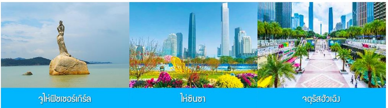
จูไห่พีชเชอร์เกิร์ล

20.00 น. นำคณะขึ้น Shuttle Bus ของโรงแรมเพื่อเดินทางไปด่านจูไห่ ผ่านพิธีการตรวจคนเข้าเมือง และนำท่านเดินทางสู่ที่พักในเมืองจูไห่ พักที่ IRVINE HOLIDAY HTL OR HUICHANG HTL 3* หรือ โรงแรมในระดับเดียวกันในเมืองจูไห่