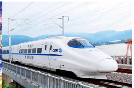
บึงรถไฟความเร็วสูง