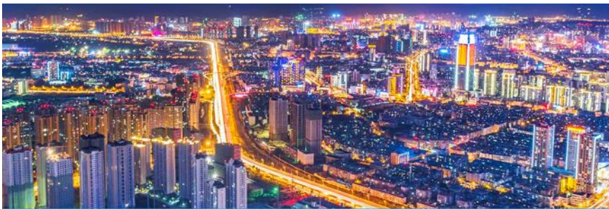
นครคุนหมิง