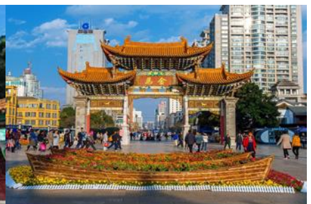
ซุ้มประตูโบราณ บ้ากวง ไก่หยก

วันที่หก คุนหมิง - KUNMING WATERFALL PARK – ตำหนักทองจีนเตียน - ซุ้มประตูโบราณ ม้าทอง ไก่หยก - ร้าน POP MART (ตามหาบุญ) - กรุงเทพฯ (สุวรรณภูมิ)