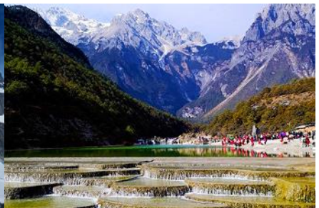
หุบเขาพระจันทร์สีน้ำเงิน "ปู้สุ่ยเหอ"