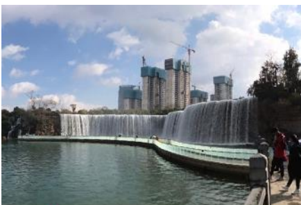
สวนน้ำตก Kunming Waterfall Park

พักที่ VIENNA HOTEL ระดับ 4 ดาว หรือเทียบเท่าในเมืองคุนหมิง