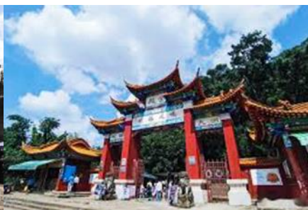
ตำหนักทองจีนเตียน