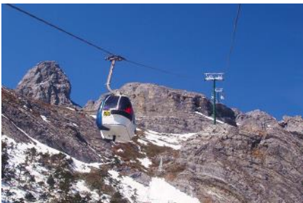
ภูเขาหิมะมังกรหยก (น้ำกระช้ำใหญ่)

ที่พัก FENG HUANG HOTEL ระดับ 4 ดาว หรือเทียบเท่าเมืองลี่เจียง