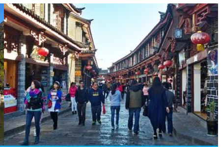
เมืองโบราณลือเจียง