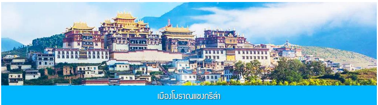
เมืองโบราณแซงการีล่า

หมายเหตุ การเที่ยวชมอุทยานช่องแคบเสือกระโจน สามารถเที่ยวได้ด้วยการเดินทางลง และขึ้นบันไดจากบริเวณลานจอดรถลงไปยังจุดชมวิวริมแม่น้ำที่อยู่ด้านล่าง (บันไดราว 430 ขั้น) หรือท่านสามารถซื้อตั๋วบันไดเลื่อนในราคา 70 -100 หยวนรวมขาลงและขาขึ้น ( โดยราคา 70 หยวนจะมีเฉพาะช่วงที่มีโปรแกรมขึ้นเท่านั้น) ค่าทัวร์ของเราได้รวมค่าเข้าชมอุทยานเสือกระโจน แต่ยังไม่รวมค่าบันไดเลื่อน หากท่านต้องการซื้อตั๋วบันไดเลื่อน ท่านสามารถแจ้งความประสงค์กับไกด์ท้องถิ่นเพื่อให้ไกด์ดำเนินการจองตั๋วแบบหมู่คณะล่วงหน้า