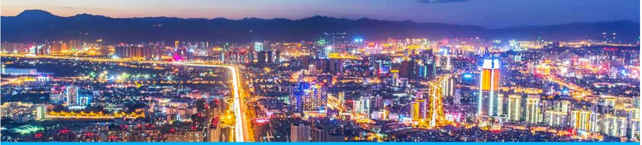
นครคุนหมิง