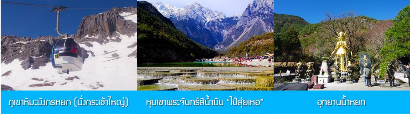
ภูเขาหิมะมังกรหยก (นั่งกระเช้าใหญ่)

ที่พัก FENG HUANG HOTEL ระดับ 4 ดาว หรือเทียบเท่าเมืองลี่เจียง