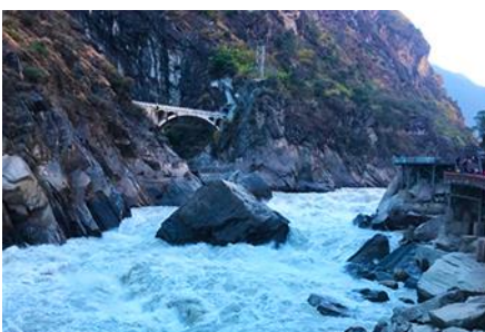
ช่องแคบเสือกระโจน

พักที่ WEN DING HOTEL ระดับ 4 ดาวหรือเทียบเท่า