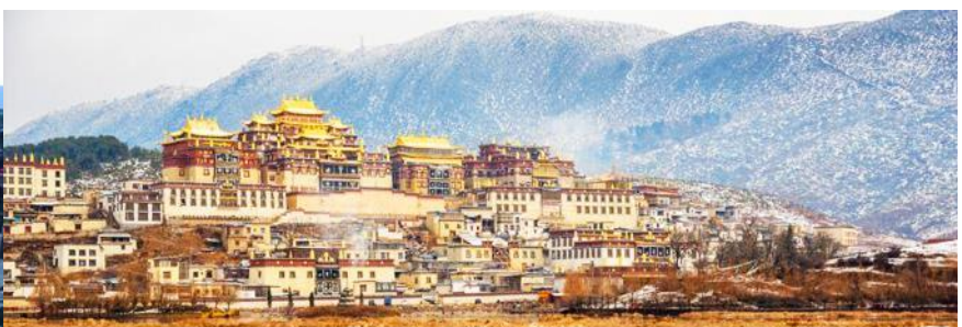
เมืองโบราณเซงกาลี