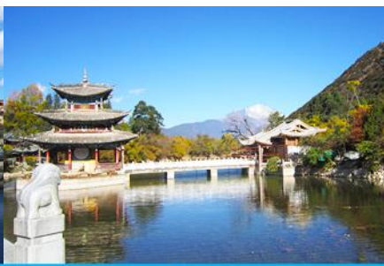
สะพานมั่งกรดำ