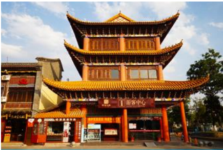
เมืองโบราณกวนตุ๋

พักที่ FEI LONG HOTEL ระดับ 4 ดาว หรือเทียบเท่าในเมืองต้าหลี่