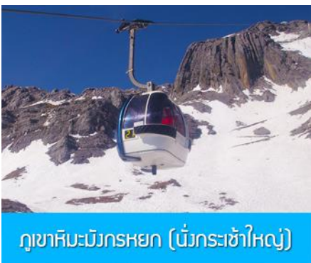
ภูเขาหิมะมังกรหยก (นั่งกระเช้าใหญ่)

ที่พัก FENG HUANG HOTEL ระดับ 4 ดาว หรือเทียบเท่าเมืองลี่เจียง