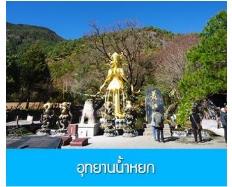
อุทยานน้ำหยก

วันที่ 1 ภูเขาหิมะมังกรหยก (รวมนั่งกระเช้าใหญ่ขึ้นลง)– หุบเขาพระจันทร์สีน้ำเงิน-น้ำตกไปสู่ยเหอ ออฟชั่น ไกด์ขายรถออล์ฟ ท่านละ 80 หยวน โชว์ IMPRESSION LIJIANG- อุทยานน้ำหยก -ต้าหลี่