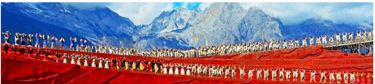
การแสดง IMPRESSION LIJIANG

หลังอาหารนำท่านชมการแสดง IMPRESSION LIJIANG โชว์อันยิ่งใหญ่โดยผู้กำกับชื่อก้องโลก “จาง อี้โหมว” ได้เนรมิต ให้ภูเขาหิมะมังกรหยกเป็นฉากหลัง และบริเวณทุ่งหญ้าเป็นเวทีการแสดง โดยใช้ นักแสดงกว่า 600 ชีวิต แสง สี เสียง การแต่งกายตระการตาเล่าเรื่องราวชีวิตความเป็นอยู่ และชาวเผ่าต่างๆ ของเมืองลี่เจียง