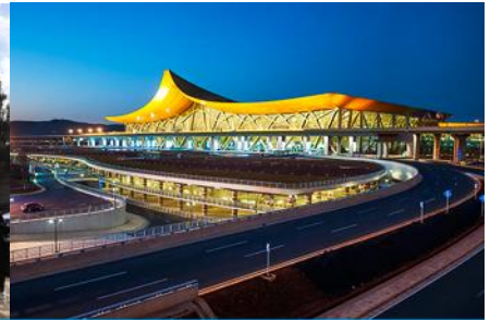
สนามบินเมืองคุนหมิง