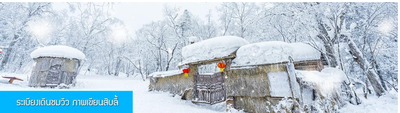
ระเบียบเดินชมวิว ภาพเขียนสิบสี่

10.30 น. นำท่านเดินทางสู่เมืองฮาร์บิ้น (ระยะทาง 267 กิโลเมตร ใช้เวลาเดินทางโดยรถบัสราว 4 ชั่วโมงเศษ) เที่ยง รับประทานอาหารกลางวัน ณ ภัตตาคาร ระหว่างทางไกด์ท้องถิ่นจะเสนอขายโปรแกรมเสริมที่ไม่ได้รวมในค่าทัวร์ (ออฟชั่นแนลทัวร์) 2 รายการ