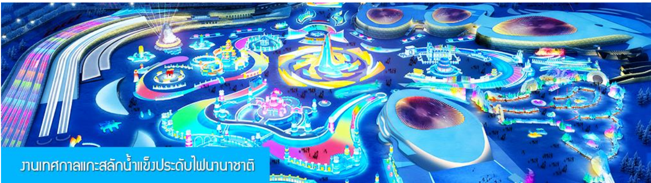
งานเทศกาลแกะสลักน้ำแข็งระดับไฟนานาชาติ