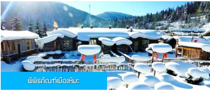
ที่พักในหมู่บ้านหิมะ

ไปยังหมู่บ้าน เมื่อลงจากรถบัสลูกทัวร์ต้องถือหรือลากกระเป๋าเข้าที่พักด้วยตัวเอง เพราะ โฮมสเตย์จะไม่มีพนักงานยกกระเป๋ามาคอยบริการยกกระเป๋าให้ผู้เข้าพัก ท่านควรจัดเตรียมกระเป๋าใบเล็กที่บรรจุเสื้อผ้า และเครื่องใช้จำเป็นสำหรับการพักผ่อน ณ โฮมสเตย์ในเมืองหิมะในคืนนี้ เพื่อสะดวกต่อการเคลื่อนย้ายกระเป๋า หมายเหตุ 2 ห้องพักในหมู่บ้านหิมะเป็น โฮมสเตย์ขนาดเล็ก เครื่องอำนวยความสะดวกและบริการอาหารเช้าเมื่อค่ำและมือเช้าจะไม่ทัดเทียมกับโรงแรมในเมือง และมีอาหารในภัตตาคารได้ ท่านควรเตรียมผ้าเช็ดตัวแปรงสีฟัน ยาสิฟัน และเครื่องใช้ส่วนตัวที่จำเป็นนำติดตัวไปด้วย