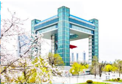
จัตุรัส ซื่อจี้