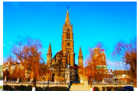
โบสถ์คอกอทลิก