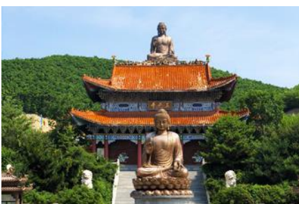
อวกัพระพุทธรูปใหญ่จีนต้ง

พักที่ WAN HAO INTER HOTEL 4* หรือ โรงแรมในระดับเดียวกัน เมืองตุนฮว่า