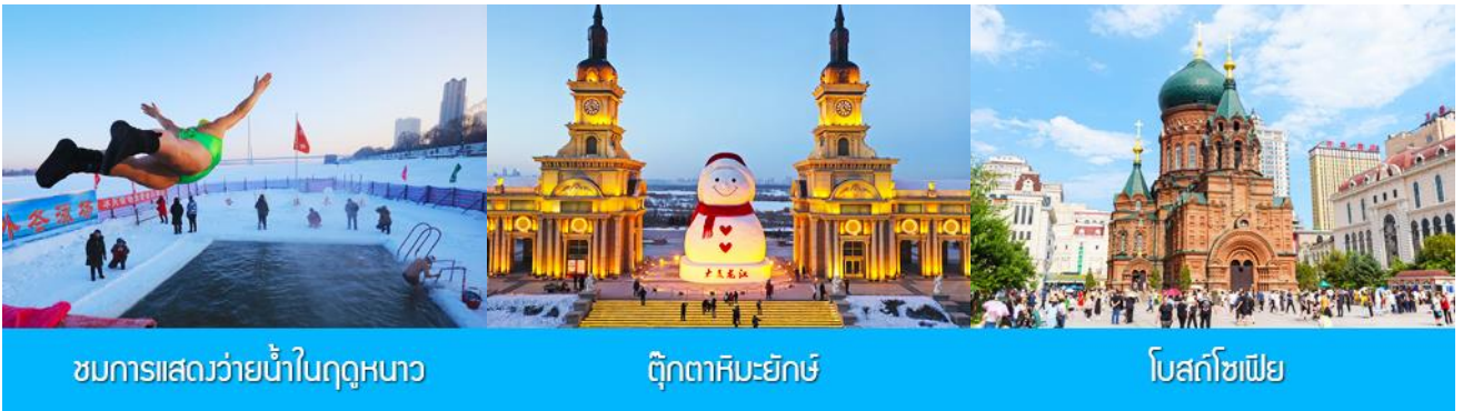
ชมการแสดงว่ายน้ำในฤดูหนาว