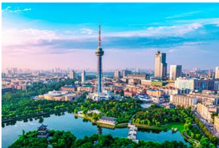
เมืองจีหลิน

23.30 น. คณะพร้อมกัน ณ ทำอากาศยานสุวรรณภูมิ อาคารผู้โดยสารระหว่างประเทศขาออกอาคาร ชั้น 4 ประตู 10 เคาน์เตอร์สายการบิน SHENZHEN AIRLINES พบเจ้าหน้าที่บริษัทฯ คอยให้การต้อนรับและอำนวยความสะดวกด้านเอกสารและสัมภาระก่อนการเดินทาง