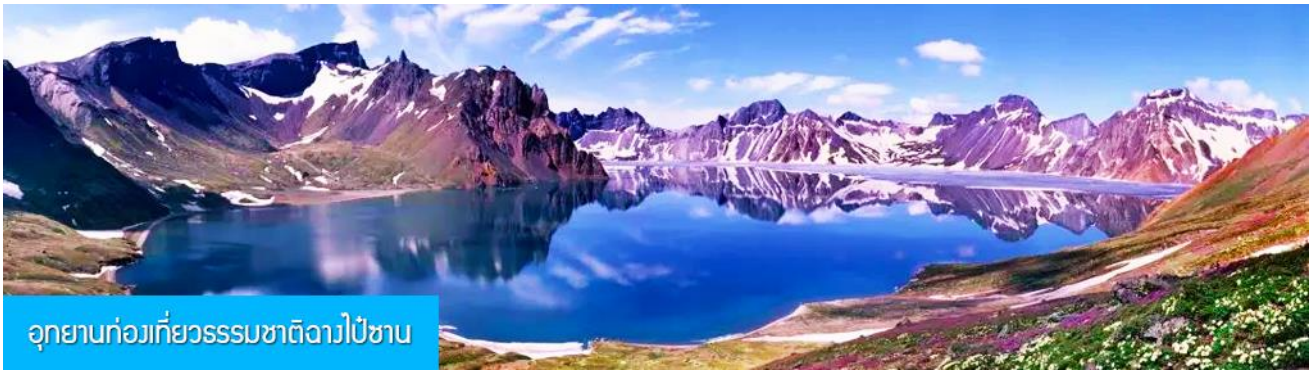
อุทยานท่งท่ี่ยวธรรมชาติฉางไป่ชาน