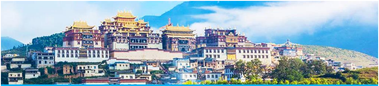
เมืองโบราณแขวงกริลา

นำท่านเดินทางเที่ยวชม เมืองโบราณแขวงกริลา เป็นศูนย์รวมของวัฒนธรรมชาวทิเบตลักษณะคล้ายชุมชนเมืองโบราณทิเบตซึ่งเต็มไปด้วยร้านค้าของคนพื้นเมืองและร้านขายสินค้าที่ระลึกมากมาย