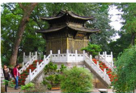
ตำหนักกอรวิญเตียน

พักที่ JINHUA HOTEL ระดับ 4 ดาวหรือเทียบเท่าในเมืองคุนหมิง