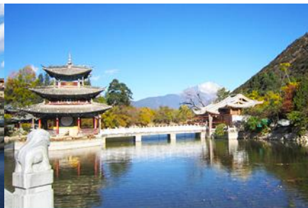
สะพานมิ่งกรดำ