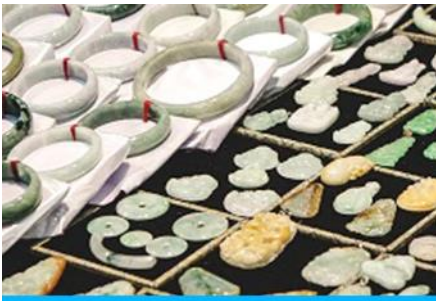
ร้านหอยก