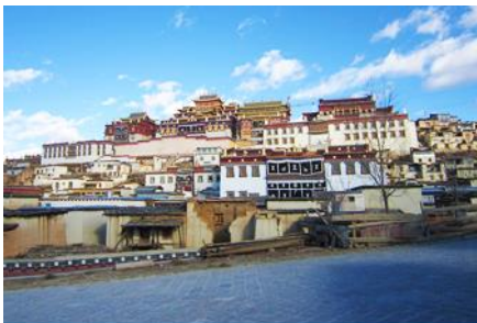
วัดลามะขงจ้านหลิง

ที่พัก YUE GUANG HOTEL ระดับ 4 ดาว หรือเทียบเท่าเมืองจงเจียน หรือแขวงกริลา