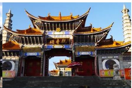
วัดเจ้าแม่กวนอิมเปลวกาย