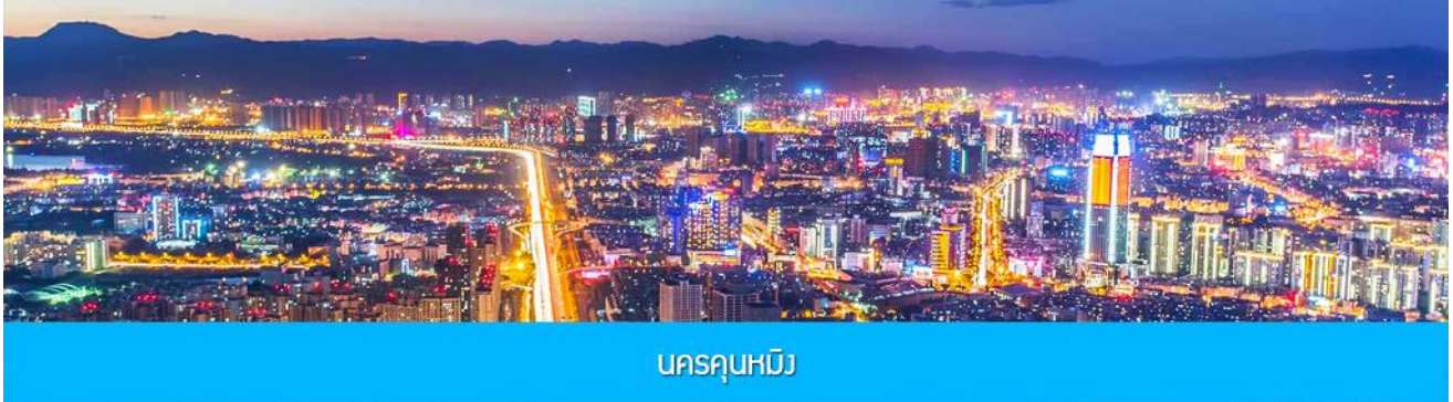
นครคุนหมิง