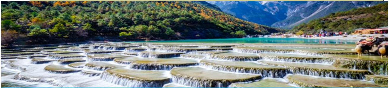
หุบเขาพระจันทร์สีน้ำเงิน Blue Moon Valley

หมายเหตุ กรณีที่กระเช้าใหญ่ขึ้นภูเขาหิมะมังกรหยกปิดให้บริการ ด้วยเหตุที่สภาพอากาศไม่เอื้ออำนวย หรือเป็นการปิดเพื่อตรวจสอบสภาพและซ่อมแซมประจำปี ทางทัวร์ขอสงวนสิทธิ์ที่จะจัดโปรแกรมขึ้นกระเช้า ที่จุดชมวิวกว๊านภูเขาหิมะมังกรหยก ณ สถานีกระเช้าหุยนซานผิง แทน