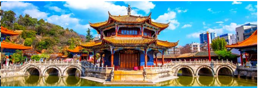
วัดหอยวนทง