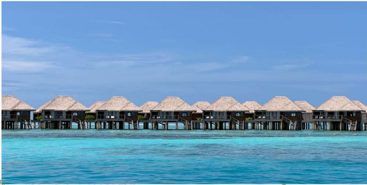
เจียบสงบ

รีสอร์ทระดับ 5 ดาวสุดพิเศษที่ให้คุณสามารถสัมผัสประสบการณ์สุดประทับใจที่มีเอกลักษณ์เฉพาะตัวคือความ เจียบสงบและความสะดวกสบายท่ามกลางบรรยากาศชายหาดสุดเก๋ ด้วยน้ำทะเลสีฟ้าใส ทรายสีขาว และ สวนปะการัง