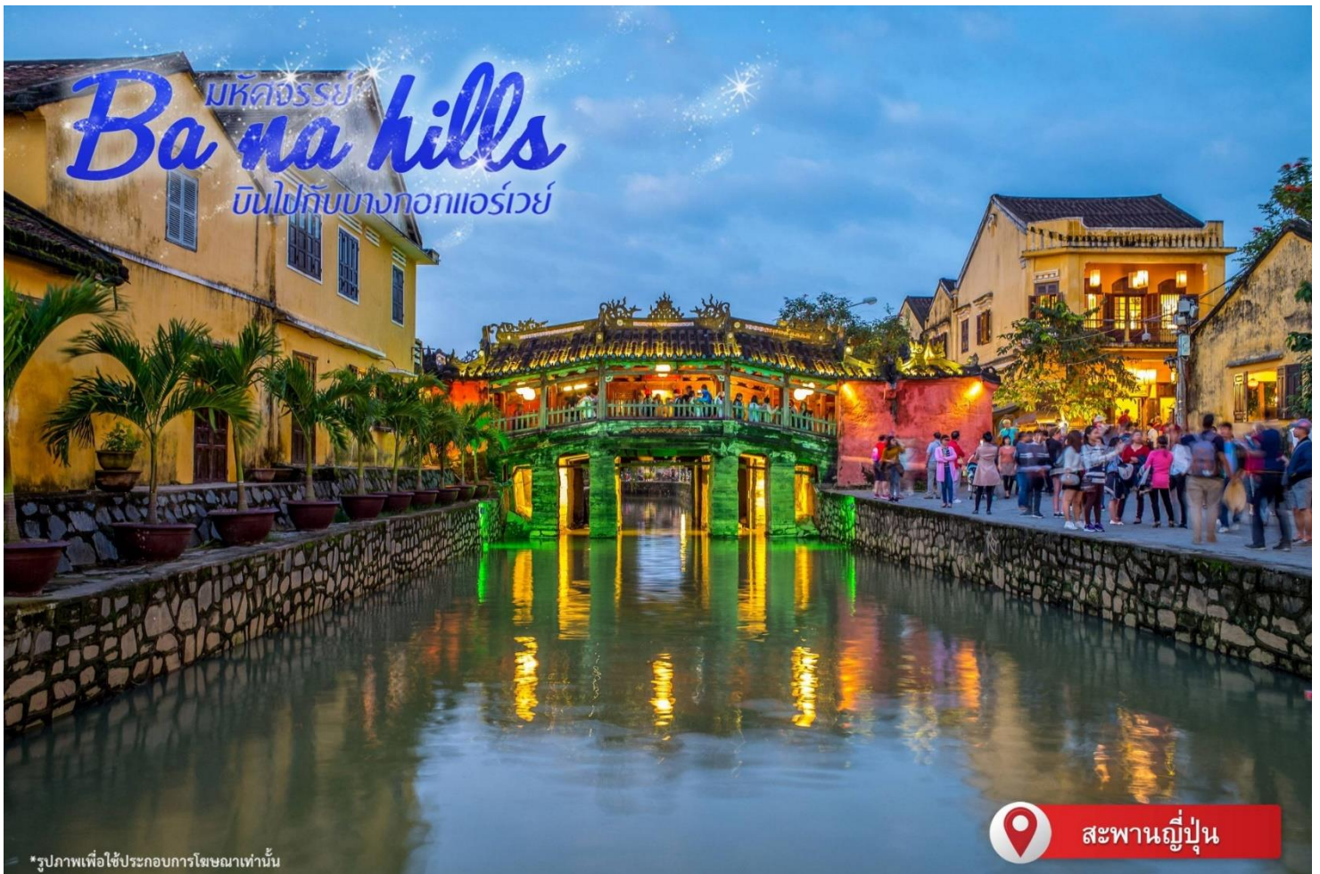
*รูปภาพเพื่อใช้ประกอบการโฆษณาเท่านั้น

ทายาทรุ่นที่เจ็ดของตระกูล การออกแบบตัวอาคารเป็นการผสมผสานระหว่างอิทธิพลทางสถาปัตยกรรมของจีน ญี่ปุ่น และเวียดนาม ด้านหน้าอาคารติดถนนเหวียนไทฮ็อกทำเป็นร้านบูติก ด้านหลังติดถนนอีกสายหนึ่งใกล้แม่น้ำทูโบนมีประตูออกไม้ สามารถชมวิวทิวทัศน์และเห็นเรือพายสัญจรไปมาในแม่น้ำทูโบนได้เป็นอย่างดีน่าสนใจ สะพานญี่ปุ่น ซึ่งสร้างโดยชุมชนชาวญี่ปุ่นเมื่อ 400 กว่าปีมาแล้ว กลางสะพานมีศาลเจ้าศักดิ์สิทธิ์ ที่สร้างขึ้นเพื่อสวดส่งวิญญาณมังกร ชาวญี่ปุ่นเชื่อว่ามี มังกรอยู่ใต้พิภพส่วนตัวอยู่ที่อินเดียและหางอยู่ที่ญี่ปุ่น ส่วนลำตัวอยู่ที่เวียดนาม เมื่อใดที่มังกรพลิกตัวจะเกิดน้ำท่วมหรือแผ่นดินไหว ชาวญี่ปุ่นจึงสร้างสะพานนี้โดยตอกเสาเข็มลงกลางลำตัวเพื่อกำจัดมันจะได้ไม่เกิดภัยพิบัติขึ้นอีก ชม ศาลกวนอู ซึ่งอยู่บนสะพาน ญี่ปุ่นและที่ฮอยอันชาวบ้านจะนำสินค้าต่าง ๆ ไว้ที่หน้าบ้าน เพื่อขายให้แก่นักท่องเที่ยวท่านสามารถซื้อของที่ระลึก เป็นของฝากกลับบ้านได้อีกด้วย เช่น กระเป๋าโคมไฟ เป็นต้น