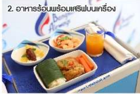
2. อาหารร้อนพร้อมเสิร์ฟบนเครื่องบิน