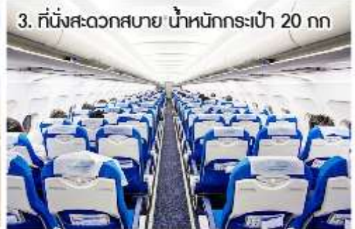
3. ที่นั่งสะดวกสบาย น้ำหนักกระเป๋า 20 กก