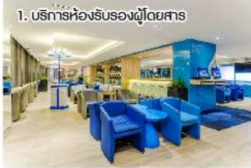
1. บริการห้องรับรองผู้โดยสาร