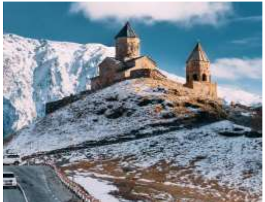
(ในกรณีที่ดินถูกปิดกั้นด้วยหิมะและส่งผลกระทบต่อการเดินทาง ทางบริษัทขอสงวนสิทธิ์ในการเปลี่ยนแปลงสถานที่ท่องเที่ยวตามความเหมาะสม ซึ่งจะคำนึงถึงความปลอดภัยเป็นหลัก)

จากนั้นนำท่านขึ้นรถ 4WD (รถขับเคลื่อน 4 ล้อ) เพื่อเข้าสู่ใจกลางหุบเขาคอเคซัส (Caucasus) นำท่านไปชมความสวยงามของ โบสถ์เกอร์เกตี (Gergeti Trinity Church) ซึ่งถูกสร้างขึ้นในราวศตวรรษที่ 14 มีอีกชื่อเรียกกันว่า ทสมินดา ซามีบา (Tsminda Sameba) ชื่อที่เรียกที่นิยมกันของโบสถ์ศักดิ์แห่งนี้สถานที่แห่งนี้ตั้งอยู่ริมฝั่งขวาของ แม่น้ำชเคเฮรี อยู่บนเทือกเขาของคาซเบก (ในกรณีที่ดินถูกปิดกั้นด้วยหิมะและส่งผลกระทบต่อการเดินทาง ทางบริษัทขอสงวนสิทธิ์ในการเปลี่ยนแปลงสถานที่ท่องเที่ยวตามความเหมาะสม ซึ่งจะคำนึงถึงความปลอดภัยเป็นหลัก) นำท่านออกเดินทางสู่ เมืองกูดาอูรี (Gudauri) ระยะทาง 39 ก.ม. ซึ่งเป็นเมืองสำหรับสกีรีสอร์ท ที่มีชื่อเสียงที่ตั้งอยู่บริเวณที่ราบเชิงเขาของเทือกเขาคอเคซัสใหญ่ ที่มีความสูงจากระดับน้ำทะเลประมาณ 2,100 เมตร สถานที่แห่งนี้เป็นแหล่งที่พักผ่อนเล่นสกีของชาวจอร์เจียที่จะนิยมมาเล่นในเดือนธันวาคมจนถึงเดือนเมษายน ซึ่งเป็นช่วงที่สวยงามและมีหิมะปกคลุมอยู่ตลอดเวลา นำท่านออกเดินทางกลับสู่ เมืองทบิลีซี (Tbilisi) ระยะทาง 121 ก.ม.