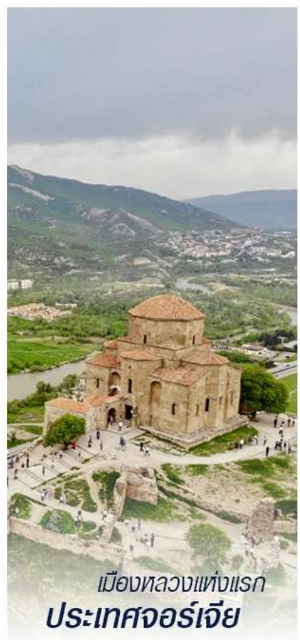
เมืองหลวงแห่งแรก ประเทศจอร์เจีย