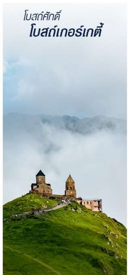
โบสถ์ศักดิ์ โบสถ์เกอร์เกตี