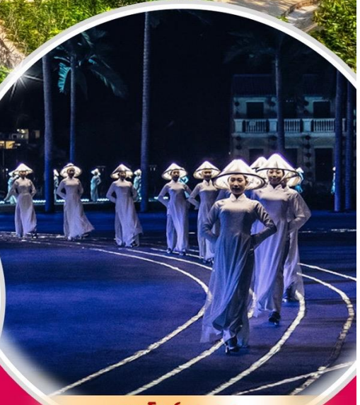
ชมโชว์ Hoi An Impressions Theme Park