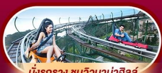
นั่งรถราง ชมวิวบาน่าฮิลล์