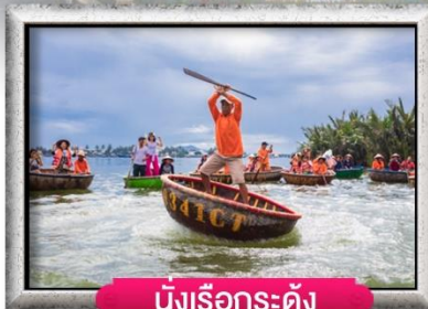
น้ิงเรื่อกระดั่ง