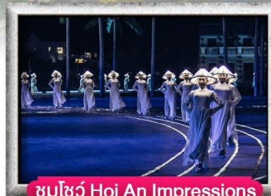
ชมโชว์ Hoi An Impressions

เมนู สุดพิเศษ Premium Seafood, Buffet Bana Hills