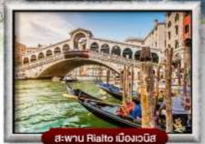
สะพาน Rialto เมืองเวนิส

พิเศษ! หอยแอมสกาโก้ + ไวน์แดงฝรั่งเศส | ซิสฟองคูลสวีตเซอร์แลนด์ สปาเกี๊ยะดีเส้นหมึกแบบเวนิส