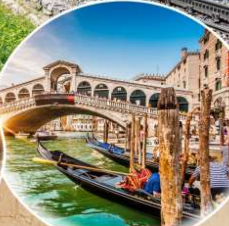
สะพาน Rialto เมืองเวนิส