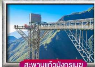
สะพานแก้วมิงกรเมซ