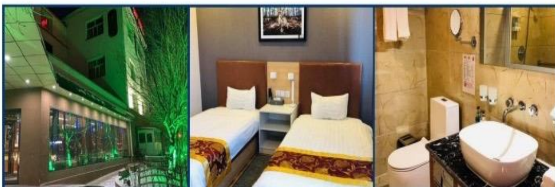
50 100 HOTEL