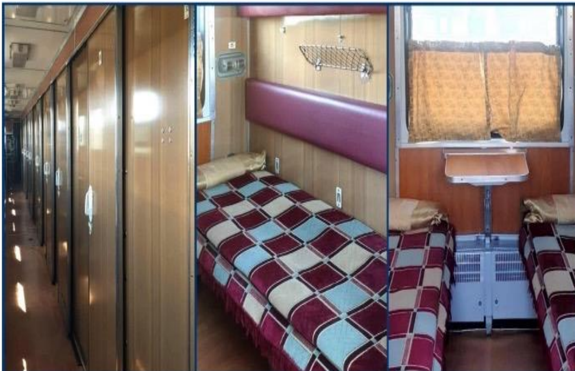
รถไฟตู้นอน