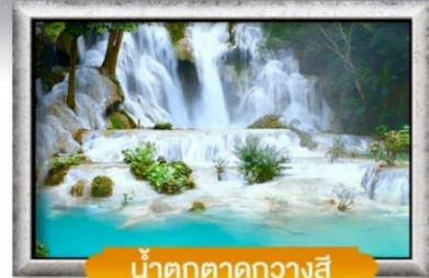
น้ำตกตาดควางสี