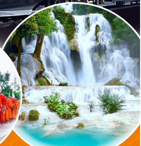
น้ำตกตาดกวางสี