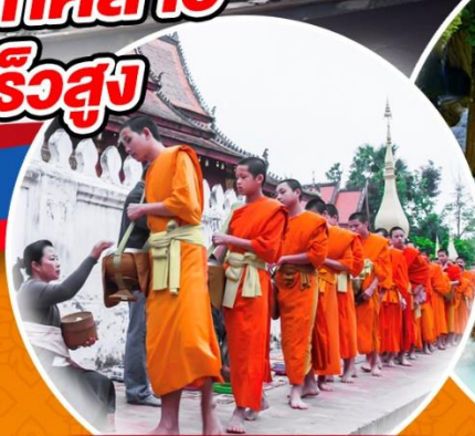
ตักบาตรข้าวเหนียว