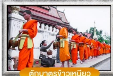
ตักบาตรข้าวเหนียว