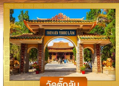
วัดดักลิ้ม