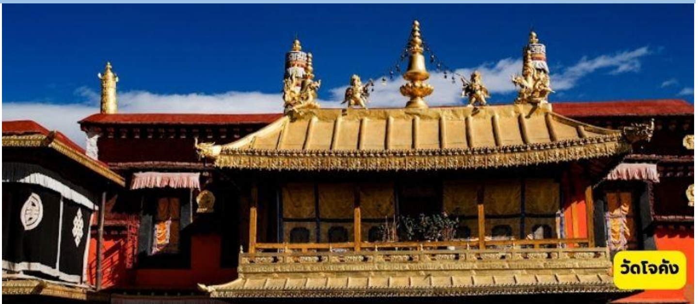
วัดโจคัง

พระราชวังโปตาลาง (ไฮไลท์) – วัดโจคัง – ถนนแปดเหลี่ยม