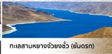
ทะเลสาบหยางจวียงซั่ว (ยิมดรก)