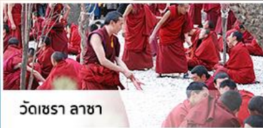
วัดเชรา ลาซา