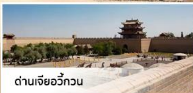
ด่านเจียวกวน