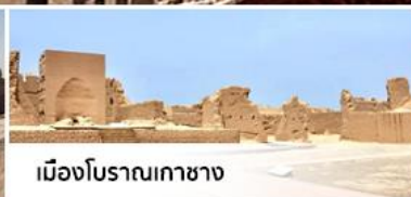
เมืองโบราณเกาซาง