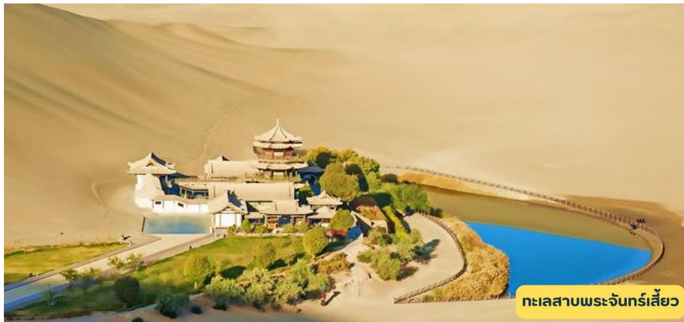
ทะเลสาบพระจันทร์เสี้ยว