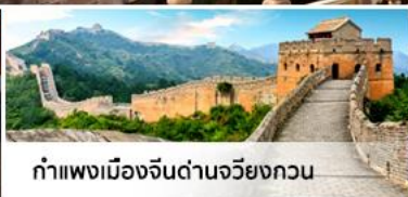
กำแพงเมืองจีนด่านจวิ๊ยกวน