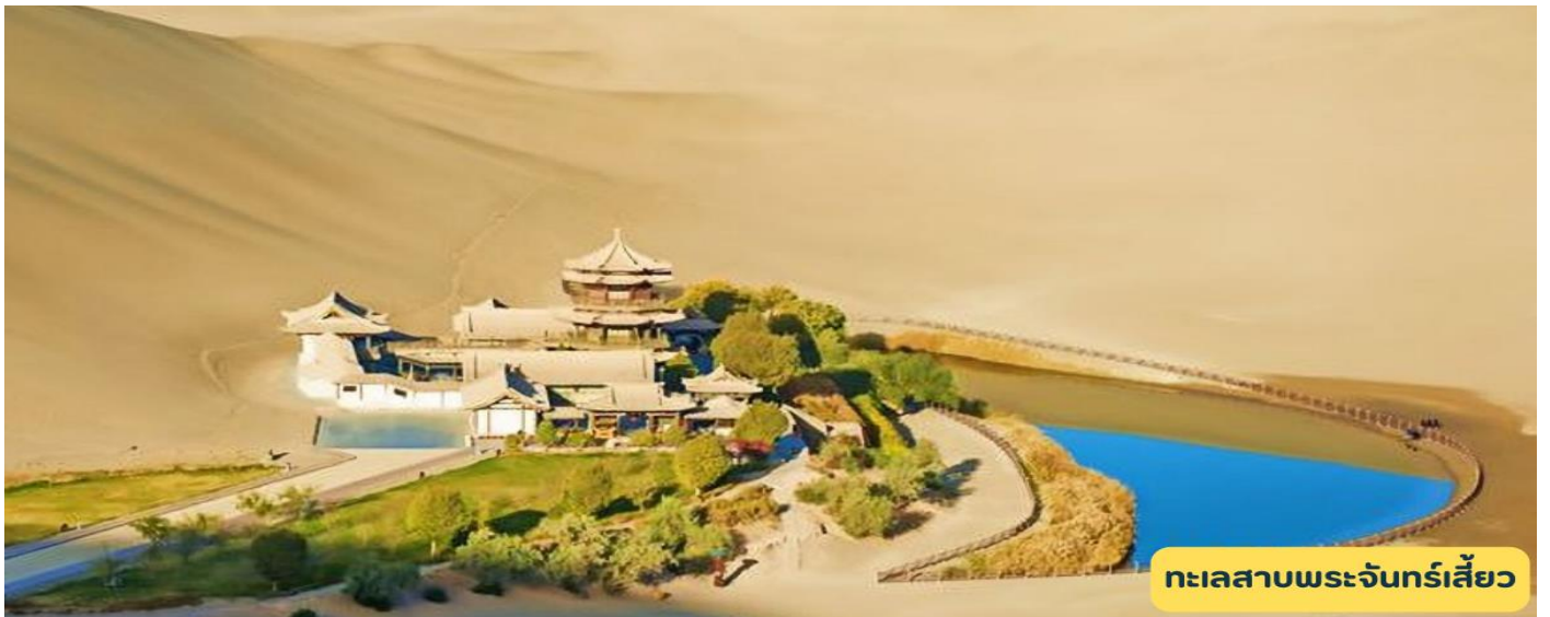
ทะเลสาบพระจันทร์เสี้ยว

วันที่สี่ เมืองเจียอี้กวน - จัตุรัสป้อมปราการ – ดูนหวง - หมิงซาซาน – ทะเลสาบพระจันทร์เสี้ยว