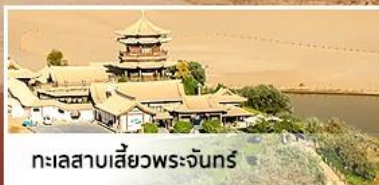
ทะเลสาบสี่ขั้วพระจันทร์

ย้อนรอยเส้นทางประวัติศาสตร์ อารยธรรมหลายพันปี