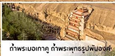
กำแพงมอเกาตู กำแพงพุทธรูปพันองค์