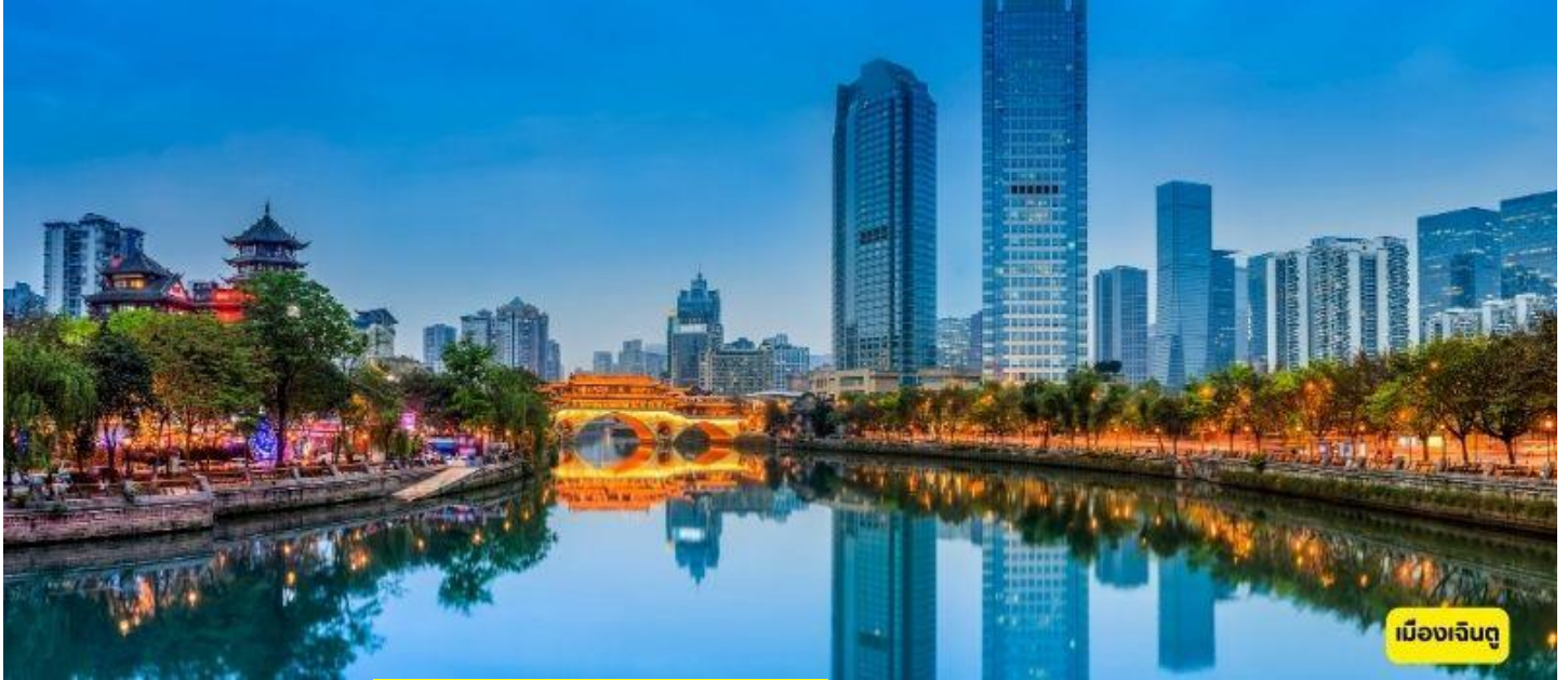
เมืองเฉินตู

วันแรก กรุงเทพฯ (ดอนเมือง/สุวรรณภูมิ) – เมืองเฉินตู (9C7502:13.35 -18.00 น.)