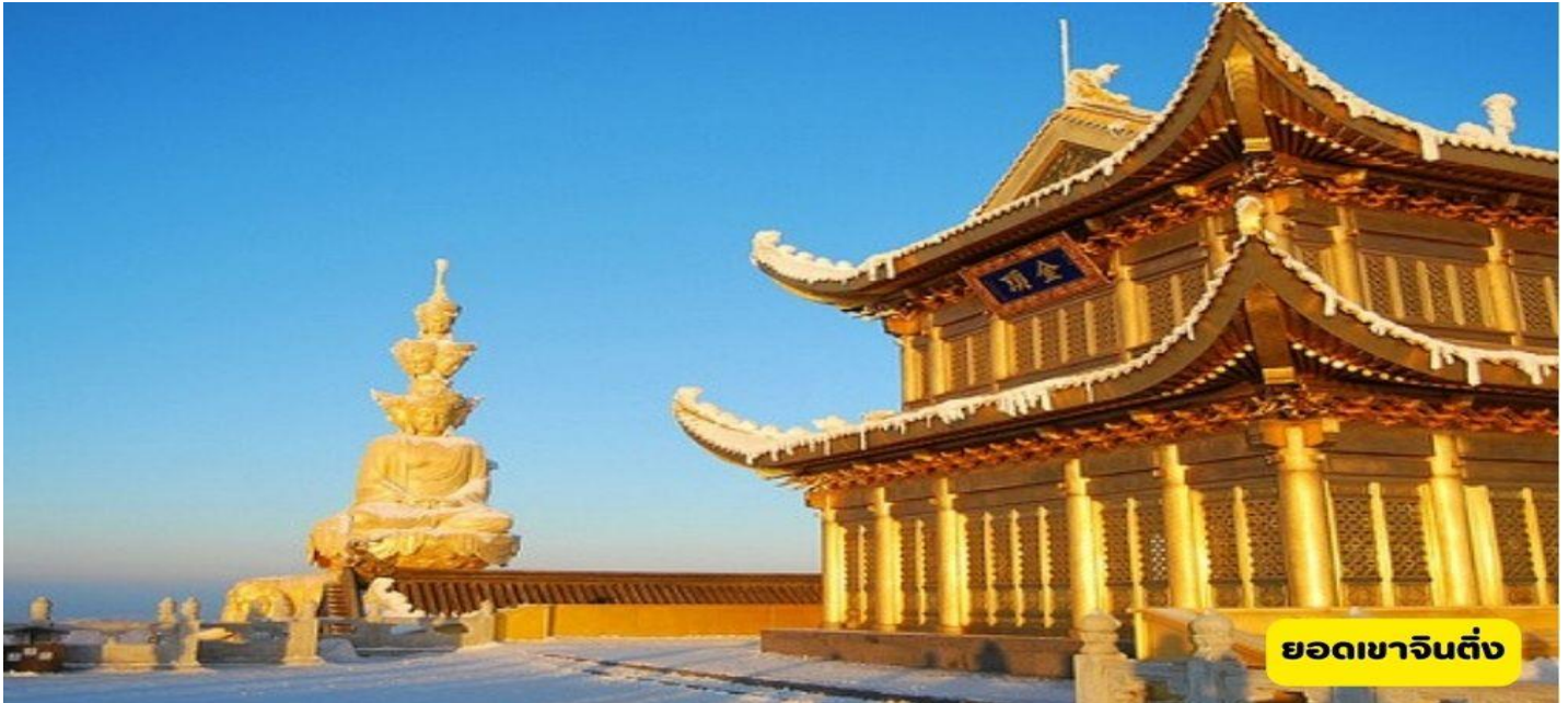
ยอดเขาจินตึง

เช้า ๑๐ | รับประทานอาหารเช้า ณ ห้องอาหารโรงแรม