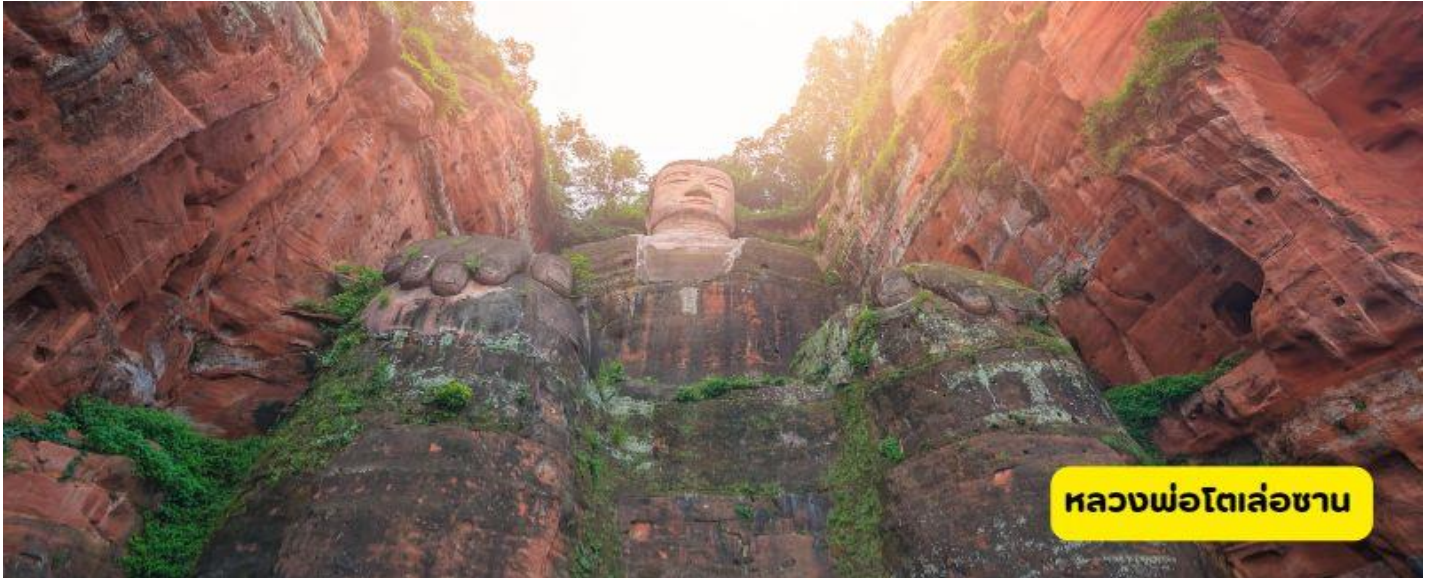
หลวงพ่อดโตเล่อซาน

เช้า 📍 รับประทานอาหารเช้า ณ ห้องอาหารโรงแรม