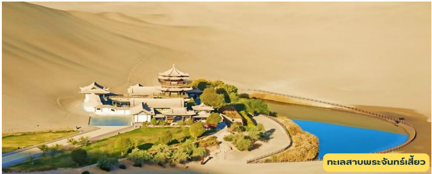
ทะเลสาบพระจันทร์เสี้ยว

เช้า ๑๐) รับประทานอาหารเช้า ณ ห้องอาหาร โรงแรม นำท่านชม จัตุรัสป้อมปราการด้านเจียอี้กวน ด้านที่สูงตระหง่านเป็นปราการที่แข็งแรง และสำคัญที่สุดในภาคตะวันตก ชมป้อมปราการที่ตั้งอยู่ที่ความสูง 1,800 เมตรจากระดับน้ำทะเลเริ่มสร้างในปี ค.ศ 1372 สร้างแล้วเสร็จภายหลังสถาปนาราชวงศ์หมิง ชมลานจัตุรัสป้อมปราการด้านในที่มีกำแพงรายล้อม ส่วนบนกำแพงสูง 10 เมตร และยาว 640 เมตร เป็นที่ตั้งของหอรังวงส่วนบนกำแพงสูง 10 เมตร และยาว 640 เมตร เป็นที่ตั้งของหอรังวงภายใน ซึ่งสร้างขึ้นในปลายราชวงศ์หมิงถึงต้นราชวงศ์ชิง ด้านหนึ่งทอดไปทางด้านตะวันตกเฉียงใต้