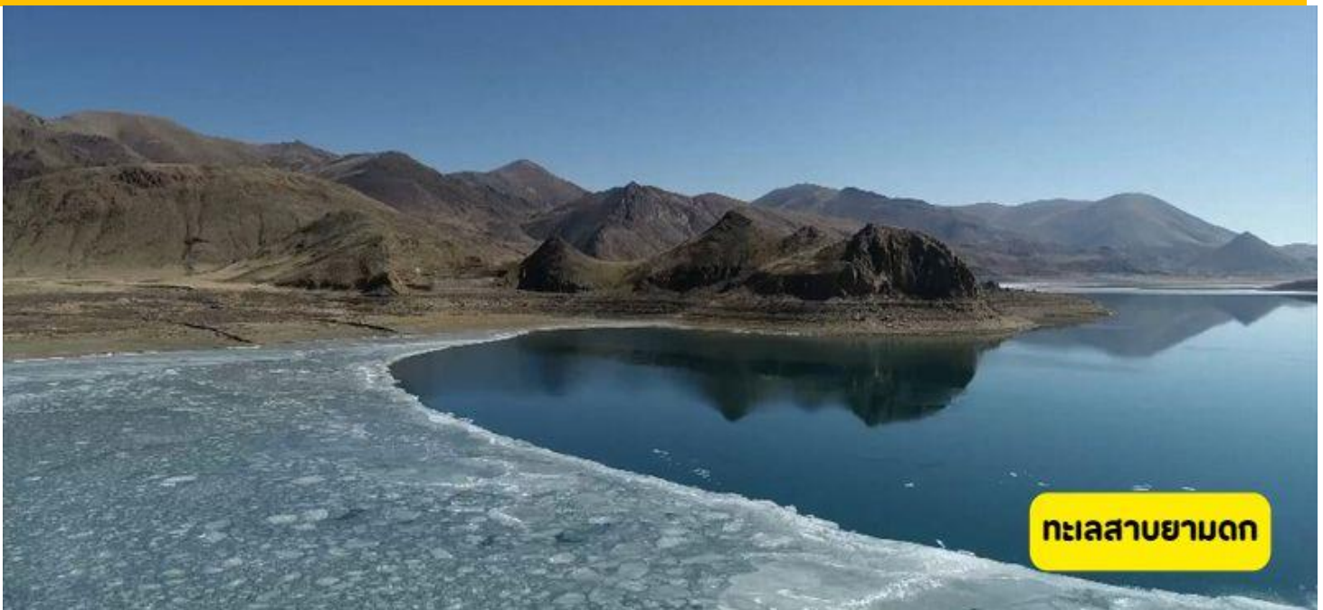
ทะเลสาบยามดก

ทะเลสาบยามดก - คาโนลา กราเซียร์ – นครซีกาเซ่