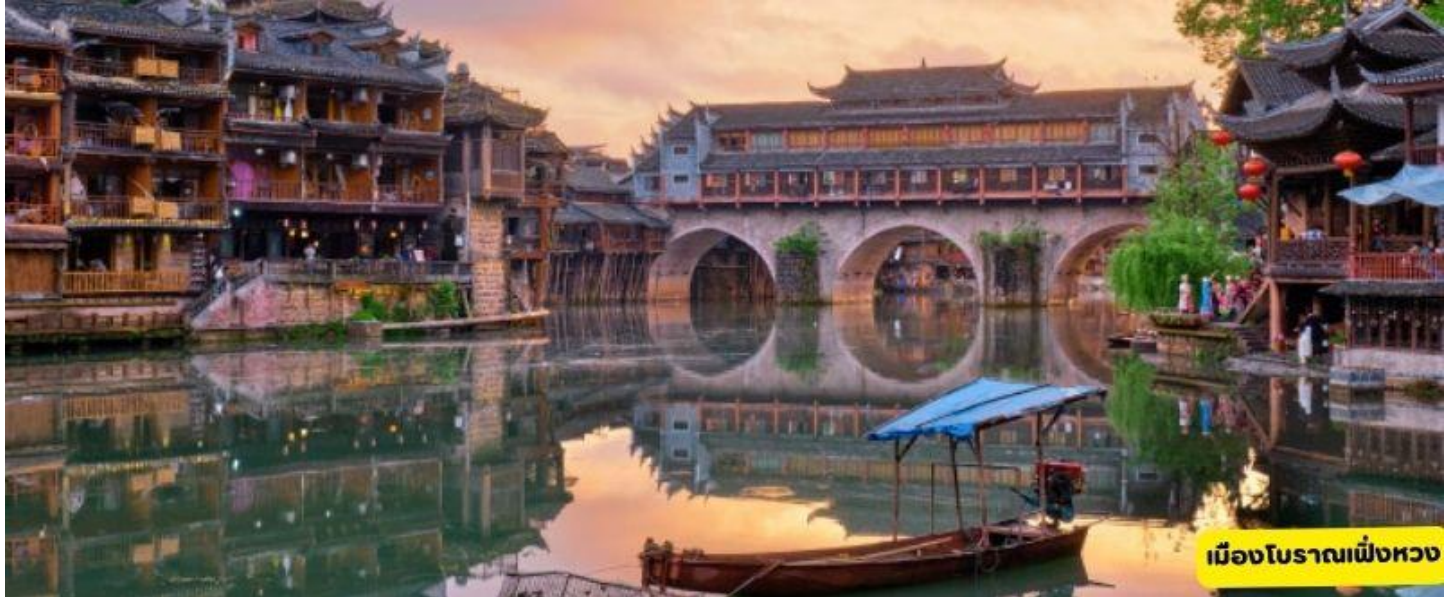
เมืองโบราณฝิ่งหวง

เมืองฟูหรงเจิ้น - ชมน้ำตก - เมืองโบราณฝิ่งหวง - ล่องเรือแม่น้ำถั่วเจียง - สะพานหงส์