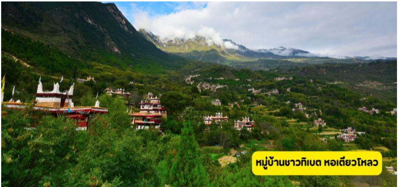
หมู่บ้านชาวทิเบต หอเตี้ยวโหลว

วันที่ 3 อุทยานภูเขาสีครุณี – หมู่บ้านชาวทิเบต - หอเตี้ยวโหลว – เมืองซินตูเจียว - เมืองหย่าเจียง