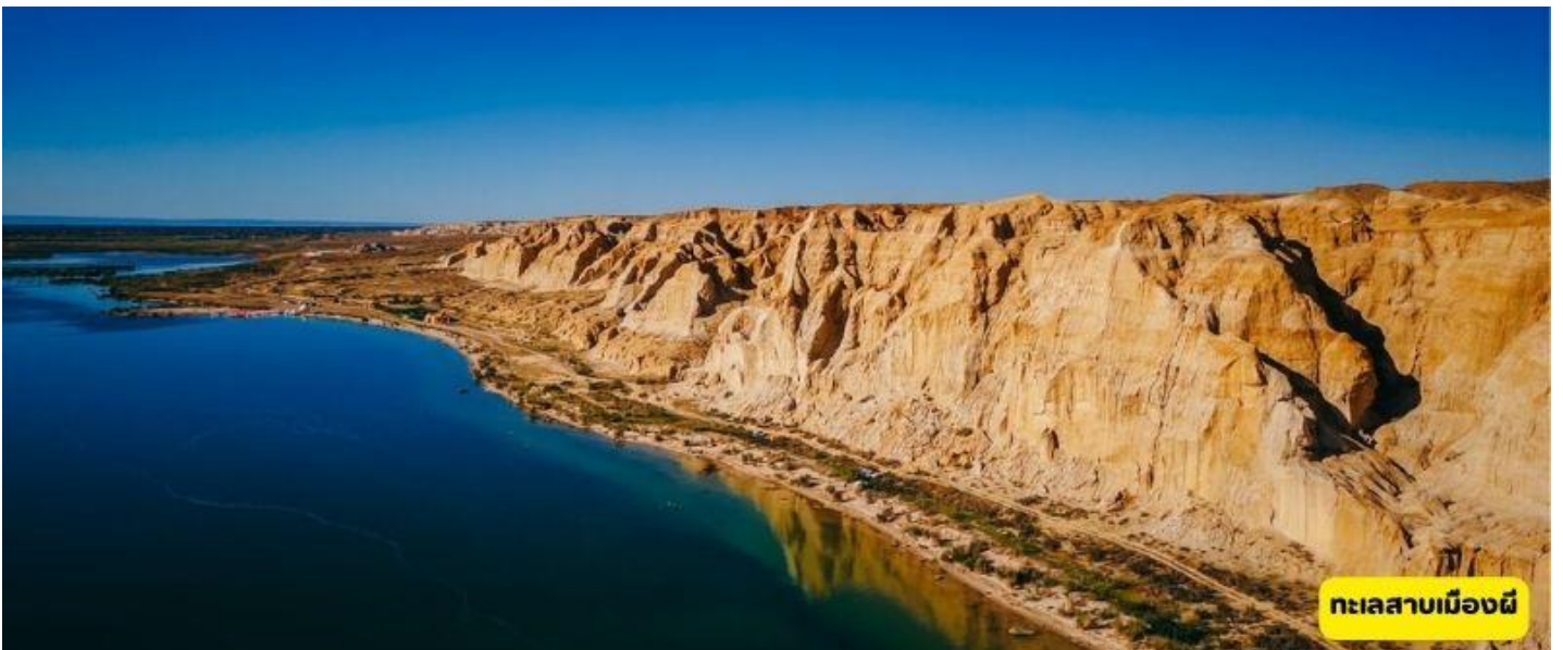
ทะเลสาบเมืองผี

เมืองอูรูมฉี – ทางด่วนS21 - ทะเลสาบเมืองผี – หาดห้าสี – เมืองบูเออิจิง