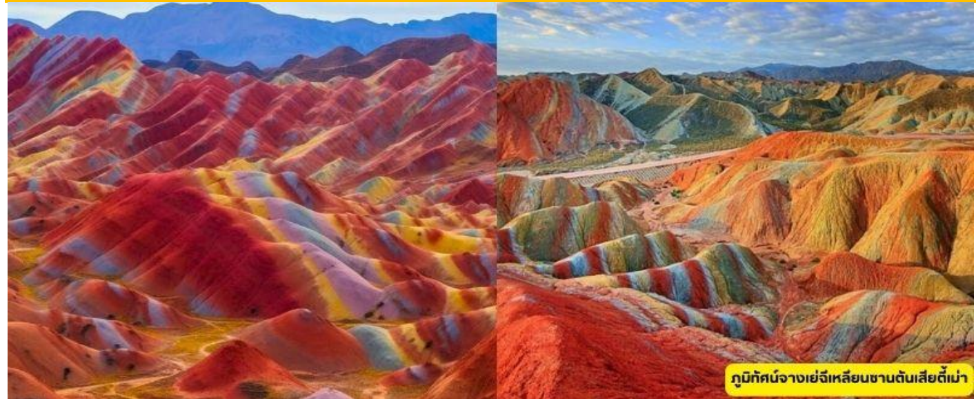
ภูมิตักษันจางเย่ฉีเหลียนซานต้นเสียดี้เม่า

เช้า ๑๐) รับประทานอาหารเช้า ณ ห้องอาหารโรงแรม หลังอาหารเช้าท่านเดินทางต่อสู่เมืองจางเย่ และนำท่านชม วัดต้าฝอซื่อ สร้างสมัยซีเซี่ยเป็นมหาวิหารประดิษฐานพระนอนที่ใหญ่ที่สุดของจีนยาวประมาณ 34.5เมตร และด้านหลังวิหารจะมีเจดีย์ไม้ (เขมู่ถ่า) จากนั้นนำท่านชม ภูมิตักษันจางเย่ฉีเหลียนซานต้นเสียดี้เม่า หรือ โขดภูหินทรายแดงหลากสี ภูเขาฉีเหลียนซาน Rainbow Mountain จัดเป็นหนึ่งในภูมิตักษันมหัศจรรย์ของจีนอันงดงามแปลกตาในเขตภูเขาฉีเหลียนซานครอบคลุมอาณาบริเวณกว้างขวางถึง 300 ตร.กม. อยู่บนระดับความสูง 2,000-3,800 ม.จากระดับน้ำทะเล ในทางธรณีวิทยาสันนิษฐานว่ามีอายุมานานกว่า 2 ล้านปี ผ่านการกัดกร่อนของธรรมชาติ สายลม แสงแดด และความแห้งแล้งของภูมิประเทศเผยให้เห็นถึงชั้นของแร่ธาตุใต้ดินที่บังเป็นริ้วเลื่อมลายหลากสี สัน พาดผ่านทั้งเนินภู แลซับซ้อนบังเป็นหุบ โตรกลึกชัน บ้างคล้ายดั่งปราสาทในดินแดนเทพนิยายและอื่น ๆ อีกมากมาย ตามจินตนาการอันหลากหลาย