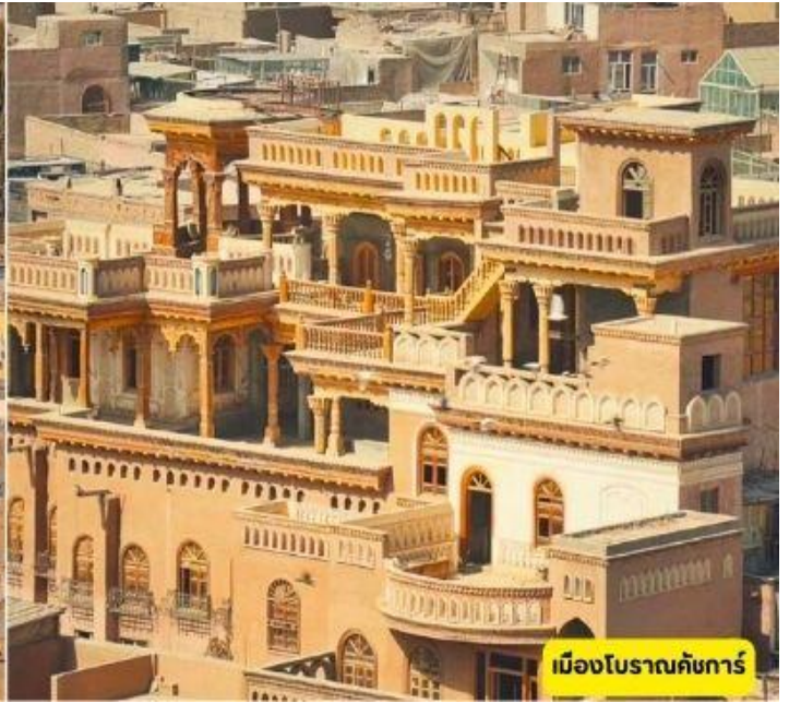
เมืองโบราณคัสการ์