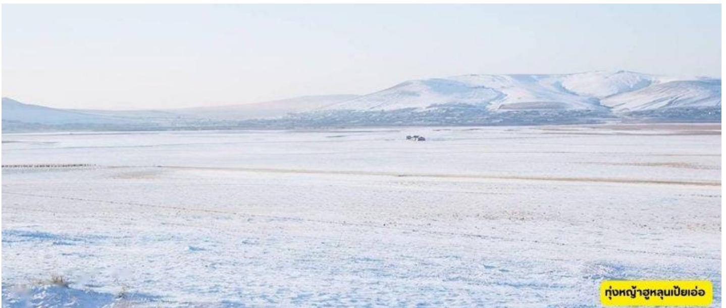
ทุ่งหญ้าฮูลุนเบียเอ่อ

ทุ่งหญ้าฮูลุนเบียเอ่อ – สู่เมืองแมนจูเลียหรือหม่านโจวหลี่