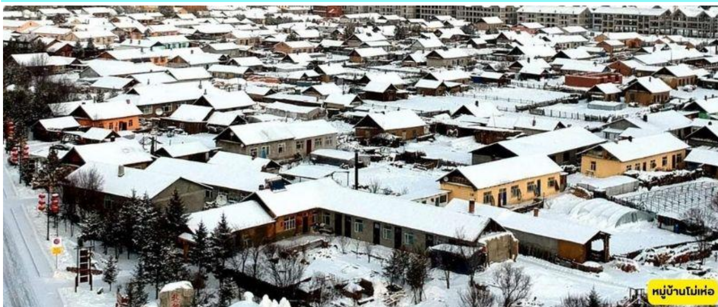
หมู่บ้านโม่เหอ

เมืองเกิ่นเทอ - จตุรัสแห่งความหนาวเกิ่นเทอ - อุทยานป่าดงดิบขงหยวน - จตุรัสเป่ย์จี - โม่เหอ