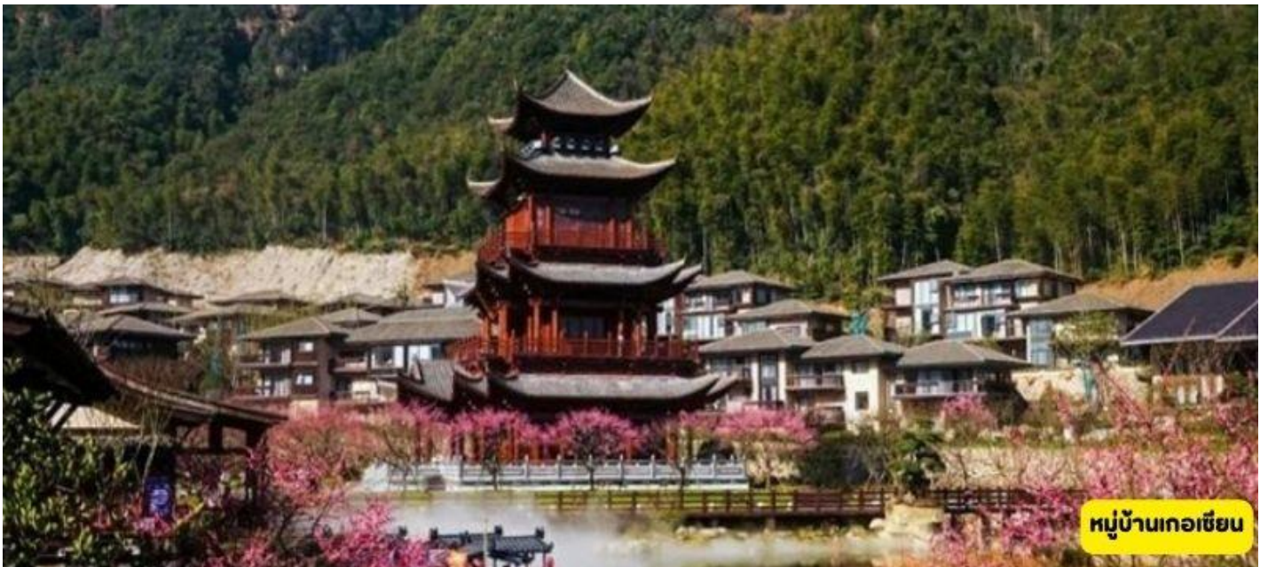
หมู่บ้านเกอเซียน

หมู่บ้านเทวดาวังเซียนกู่ - ซ่างเหรา - ภูเขาหลิงซาน - ท้องฟ้ากระจก - หมู่บ้านเกอเซียน