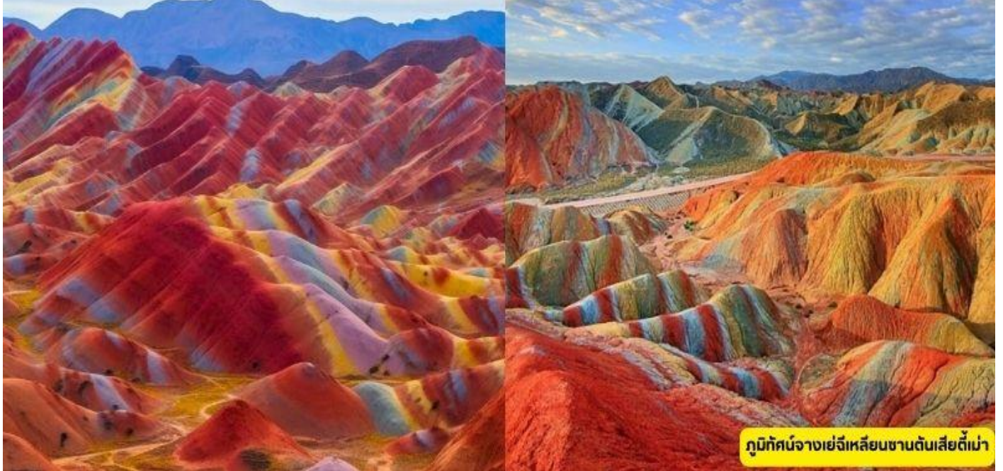
ภูมิตทัศน์จางเย่ฉีเหลียนซานตันเสียดี้เมา