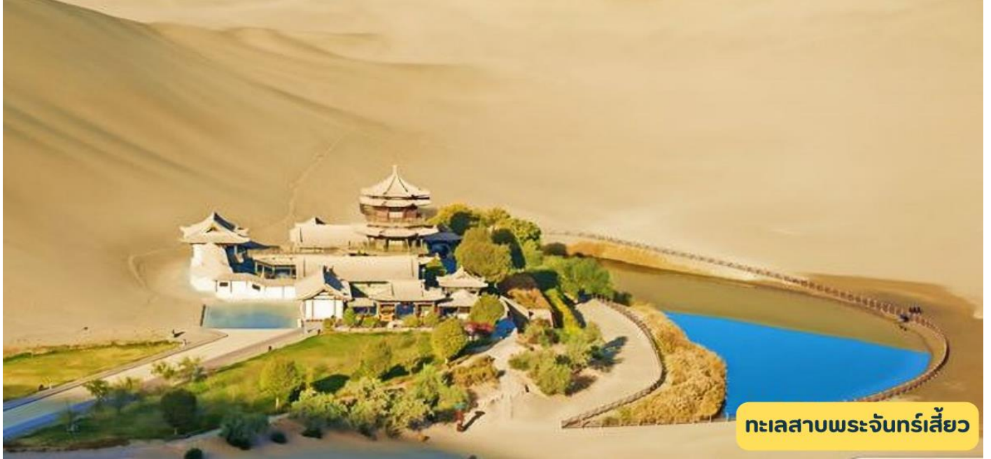
ทะเลสาบพระจันทร์เสี้ยว