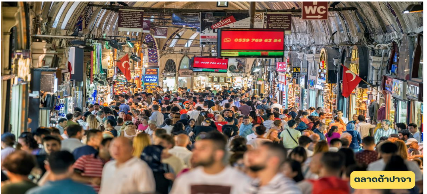
ตลาดต้าปาจา

เช้า 🎯 รับประทานอาหารเช้า ณ ห้องอาหารโรงแรม นำท่านสู่ เมืองโบราณเกาซางกู่เจิง อายุกว่า 1,000 ปี เป็นซากเมืองโบราณที่เคยรุ่งเรืองในอดีตซึ่งมีอารยธรรมโบราณที่สามารถจินตนาการได้ ถึงความเจริญรุ่งเรืองในอดีตกาล โดยนำท่านนั่งรถกอล์ฟนำชมบริเวณเมืองเก่าตามจุดไฮไลท์ เช่น วัดเก่า และบริเวณโบสถ์ที่ท่านพระถังซัมจั๋งเคยเดินทางมาพักและแสดงเทศนาธรรม ณ เมืองแห่งนี้ จากนั้นนำท่านเดินไปสักการะ เขียนผ่องตั้ง หรือ ถ้ำพระพันองค์ ซึ่งเป็นมรดกโลกของจีน โบราณที่มีชื่อทางผลงานทางพุทธศิลป์ เช่นพระพุทธรูปและงานจิตรกรรมฝาผนัง ที่ถูกสร้างขึ้นตั้งแต่ศตวรรษที่ 7 ซึ่งมีถึง 94 ถ้ำ จากนั้นนำท่านผ่านชม ภูเขาเปลวเพลิง หรือผ่อเยียนซาน ซึ่งเป็นที่รู้จักกันดีในนวนิยายเรื่องไซอิ๋ว ตอนที่ซุนหงอคงไปขอยืมพัดเหล็กกายสิทธิ์จาก องค์หญิงมาดามไฟในภูเขาเปลวเพลิง เพื่อให้พระถังซำจั๋งได้เดินทางไปเชิญพระไตรปิฎกที่อินเดียต่อ ภูเขาเปลวเพลิงนี้มี ลักษณะเป็นภูเขาสี่อิฐทั้งภูเขา นับเป็นจุดที่ร้อนที่สุดจุดหนึ่งของโลก