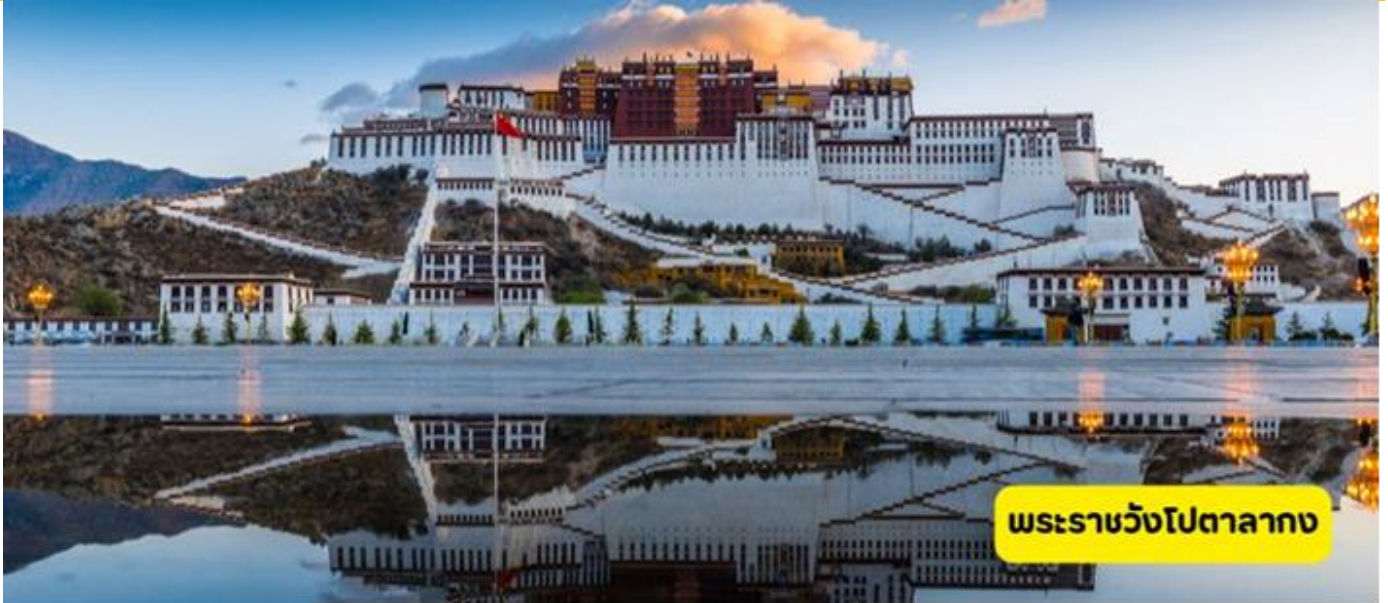
พระราชวังโปตาลง

เช้า 🕒 รับประทานอาหารเช้า ณ โรงแรม นำท่านเข้าชม พระราชวังโปตาลง ( POTALA PALACE ) **ห้ามนำน้ำดื่มและกล้องถ่ายรูป เข้าในพระราชวัง** เป็นสถานที่ที่เลื่องชื่อติดอันดับโลก แรกของประเทศจีน(CHINA’S WORLD HERITAGE) สร้างขึ้นในสมัย พุทธศตวรรษที่ 13 เนื้อที่ 120,000 ตร.ม. ตั้งอยู่บนยอดเขามาร์โปรี (เขาแดง) เป็นอาคาร 13 ชั้น มีห้องต่างๆเกือบ 1,000 ห้อง และมีเสาค้ำยันอยู่กว่า 15,000 ต้น สร้างโดยกษัตริย์ของจีนกัมโปทรงมีพระบัญชาให้สร้างขึ้นใน ศตวรรษที่ 7 สำหรับพระมเหสี 2 องค์ ที่เป็นชาวจีนและชาวเนปาล ต่อมาใช้เป็นสถานศึกษาพระธรรม คาโลลามะทุกพระองค์ทรงพำนักที่นี้ ในฐานะผู้นำของประเทศและศาสนา เมื่อมองจากด้านบนของพระราชวังโปตาลา ท่านสามารถชมทัศนียภาพหุบเขาและเมืองลาซาได้ชัดเจน (ขอแนะนำให้ทุกท่านเข้าชมเมื่อท่านได้เดินทางเข้าชมแล้วจะทำให้ท่านรู้สึกปรับสภาพร่างกายได้ดีขึ้น)