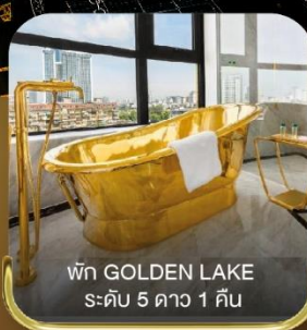
พัก GOLDEN LAKE ระดับ 5 ดาว 1 คืน