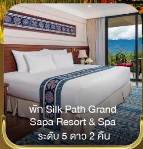
พัก Silk Path Grand Sapa Resort & Spa ระดับ 5 ดาว 2 คืน