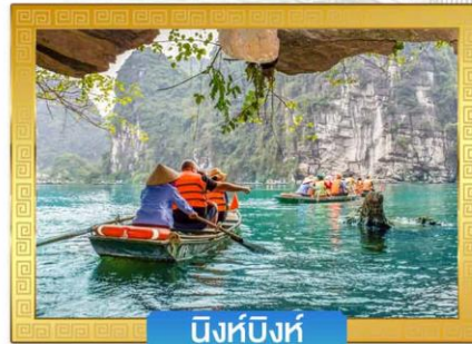
นิงห์บิงห์