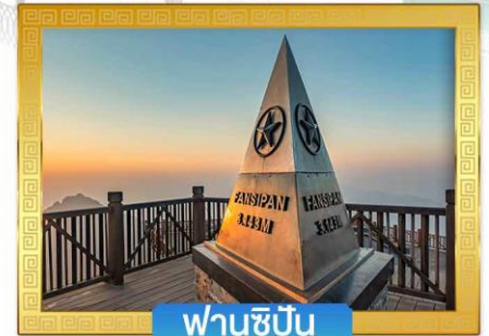
ฟานซีปิ่น