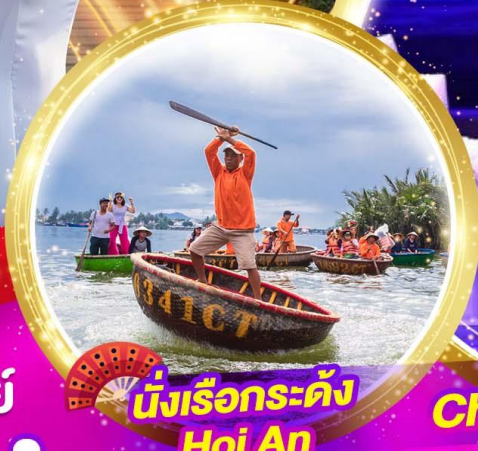
นั่งเรือกระด้ง Hoi An