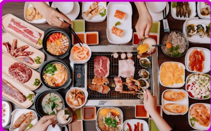
พิเศษ!! เมนูซาซิมิ+บุฟเฟ่ต์ปิ้งย่าง