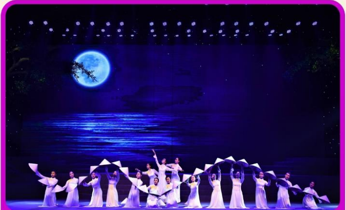
ชมการแสดง Charming Show Danang