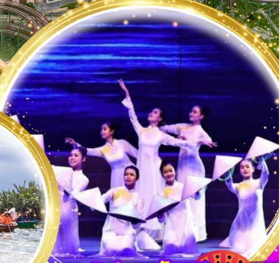
โชว์สุดอลังการ Charming at danang