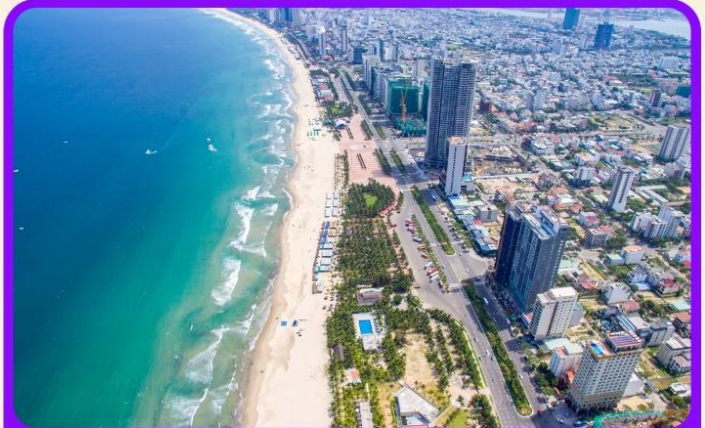
เช็คอิน ชายหาดหมีเคว เป็นชายหาดที่สวยงามที่สุดในเมืองดานัง