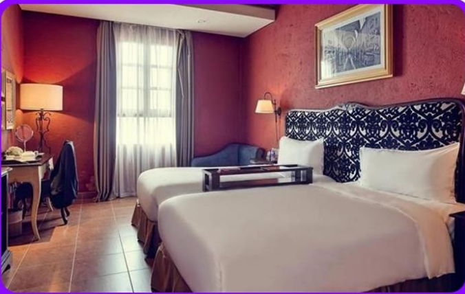
พักบนบานาฮิลล์ 1 คืน