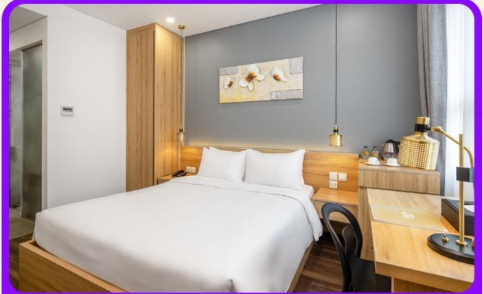
พักเมืองดานัง 4 ดาว 2 คืน