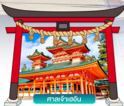
ศาลเจ้าเฮอัน