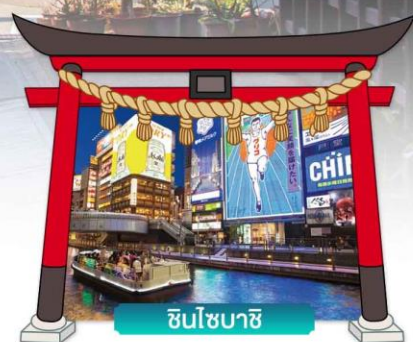
ชินโซนาชิ