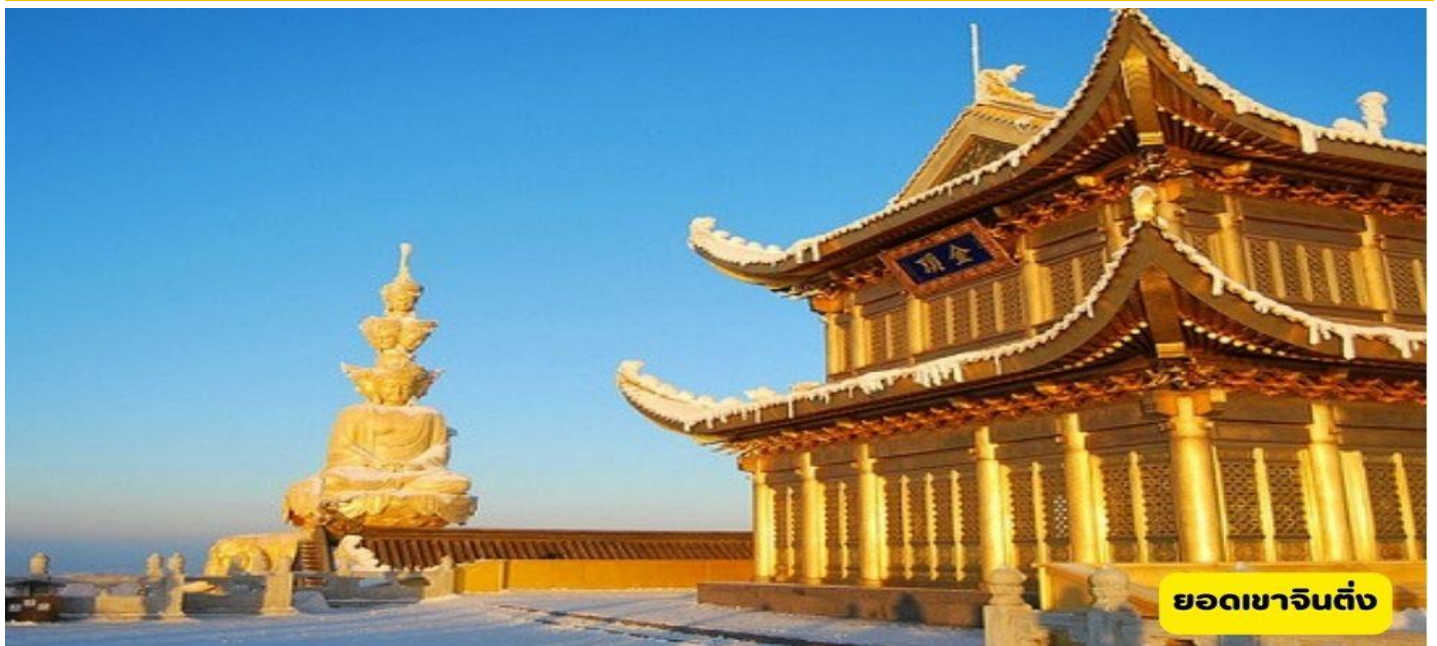
ยอดเขาจินตึง

วันที่ 6 ง้อไบ๊ - ยอดเขาทองคำจินตึง - วัดเป้ากั๋ว