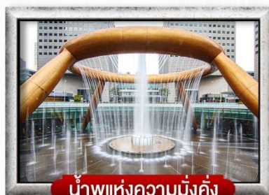
น้ำพุแห่งความมั่งคั่ง