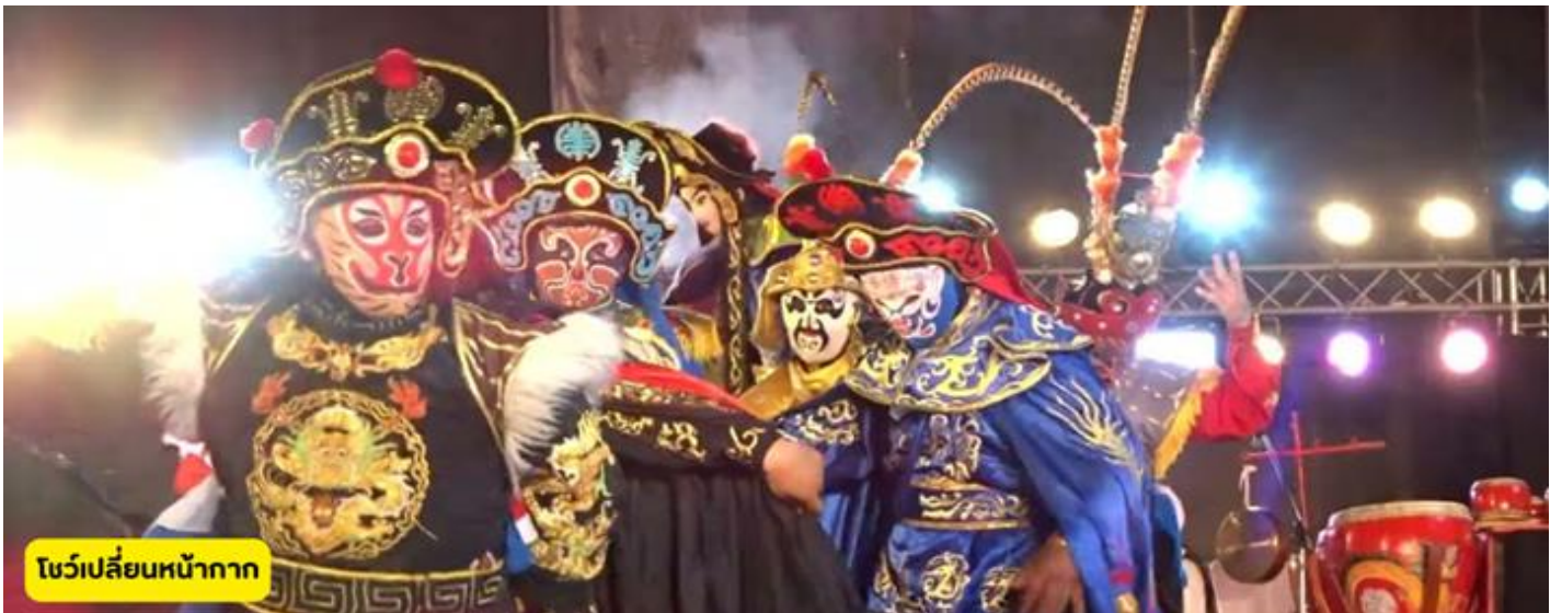
โข่วเปลี่ยนหน้ากาก

วันแรก กรุงเทพฯ (สุวรรณภูมิ) – เมืองฉินตู - โข่วเปลี่ยนหน้ากาก TG618:10.55 -15.05