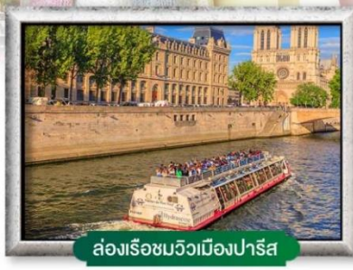
ล่องเรือชมวิวเมืองปารีส