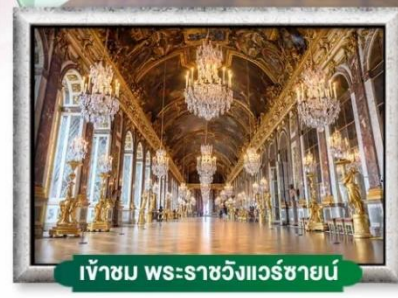
เข้าชม พระราชวังแวร์ซายน์

พิกัดกลางเมือง ใกล้ Metro เดินทางสะดวก 🍴 อาหาร : 6 มื้อ 🏨 โรงแรม : 4 ดาว