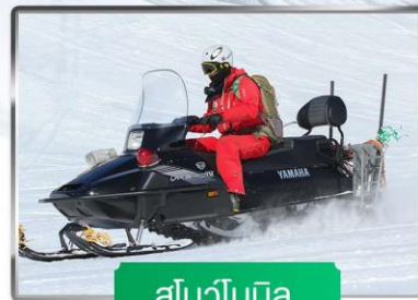
สโนว์โมบิล