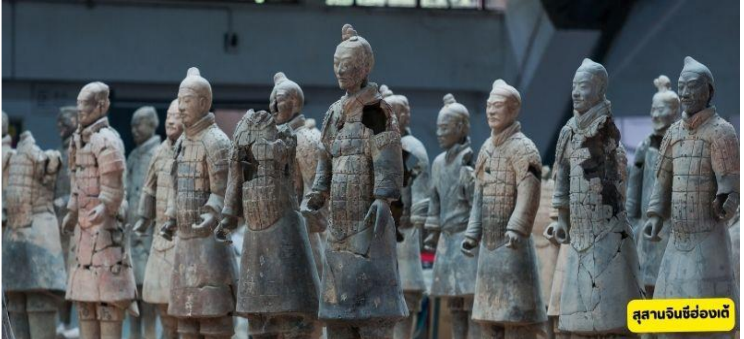
อุทยานจีนซีอองเต้

อุทยานจีนซีอองเต้ - วัดต้าฉือเอิน - เจดีย์ห่านป่าใหญ่ - ถนนต้าถังเมืองที่ไม่เคยหลับใหล