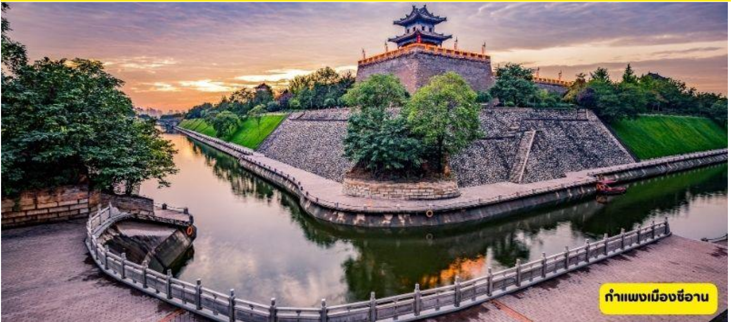
กำแพงเมืองซีอาน

นั่งรถไฟสูงสู่เมืองซีอาน - วัดกว้างเหริน - กำแพงเมืองซีอาน - หอระฆัง - ถนนคนเดินมุสลิม