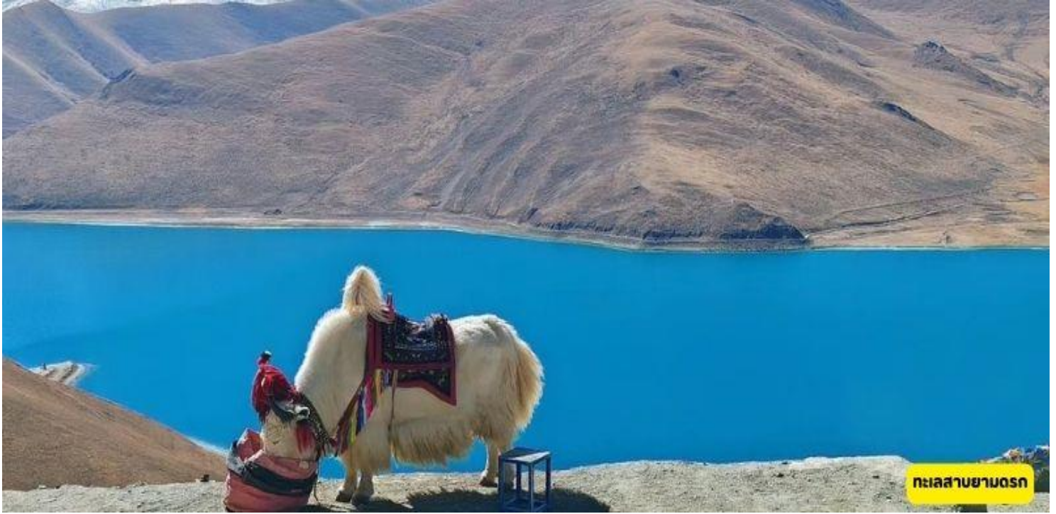
ทะเลสาบยามดก